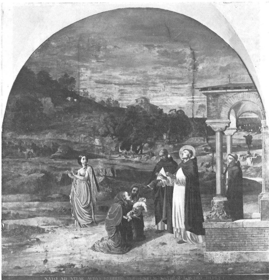
Fig. 1 - Hyacinthe Besson, La Résurrection de l'enfant , peinture murale, Rome, Salle capitulaire de Saint-Sixte.