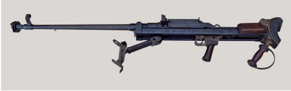
Fig. 1 - Il fucile Boys MK I matricola A 4560.