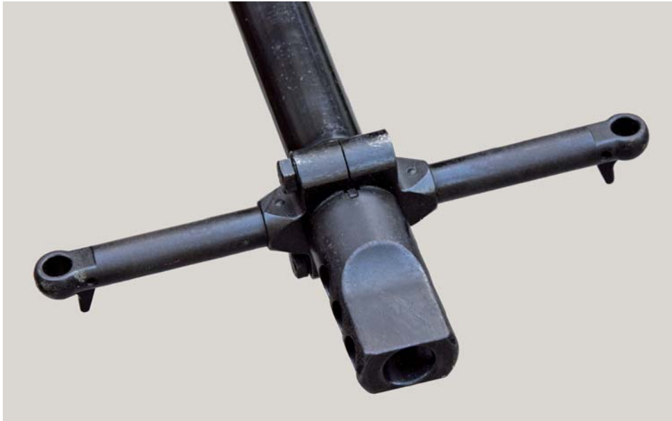
Fig. 10 - Il particolare freno di bocca del fucile Solothurn. Si notino i supporti per le bandierine laterali.

con bipiede e in grado, su idoneo affusto, di ingaggiare anche mezzi terrestri e aerei e proprio per questo battezzato dalla ditta “Universalwaffe”.