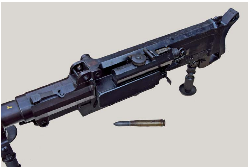
Fig. 8 - La parte posteriore del fucile anticarro Solothurn. Posata a terra la relativa munizione da 20 mm.