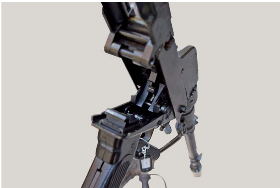
Fig. 7 - Dettaglio del Granatebüchse 39 aperto per camerare la cartuccia. Evidente la complessità del meccanismo.

“bnz 1941” è stata successivamente posizionata una targhetta metallica fissata al castello mediante punzonamento recante la nuova sigla e matricola dell’arma di derivazione, ossia “Gr B 39 1211”. Lo stesso numero 1211 è inciso mediante punzone sulla piastrina laterale porta-munizioni, mentre alla base della canna, sulla parte superiore compaiono sovrapposti verticalmente i numeri “1936-1940-R712”. Al lato sinistro dell’attaccatura della canna sono incisi non meno di 4 Waffenamt di controllo ispettivo dell’arma.