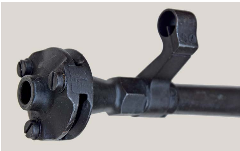
Fig. 3 - Il freno di bocca di primo tipo del Boys matricola C1540.