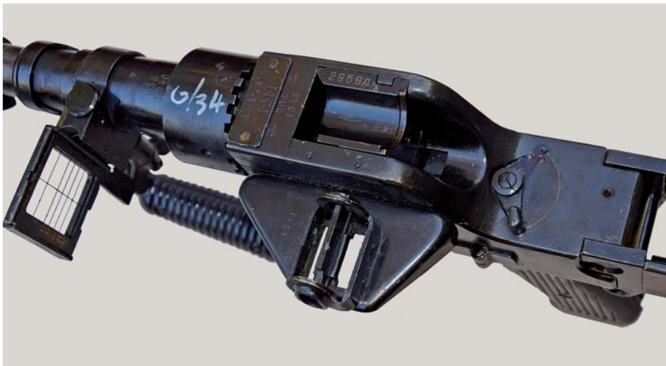
Fig. 6 - La culatta e il sistema di mira del Granatebüchse 39.

la cartuccia, dotata ora di proiettile in legno, e diversa anche la denominazione della nuova arma, che diventava “Granatbüchse Modell 39 (GrB 39)” e che rimase così in uso sino al termine del conflitto.