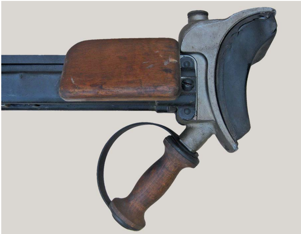
Fig. 2 - Dettaglio del poggiaspalla del fucilone controcarro Boys Mk II matricola F6233.