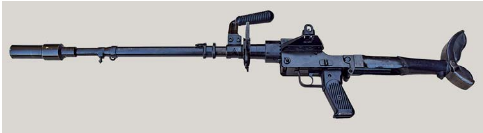
Fig. 5 - Il Granatebüchse 39.