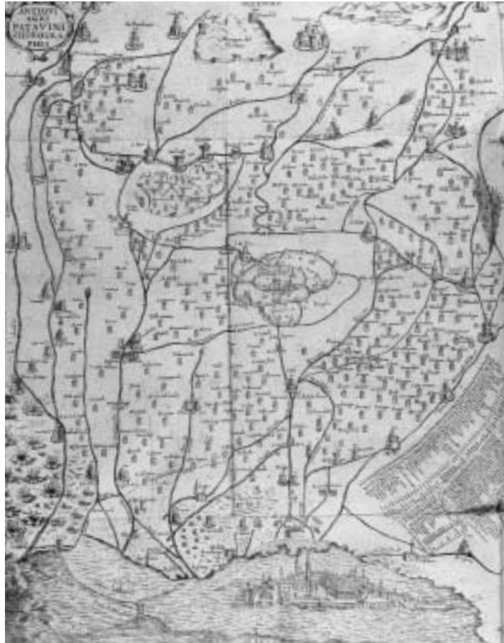
7. Pianta del territorio padovano, tratta da SERTORIO ORSATO, Historia di Padova , Padova, per Pietro Maria Frambotto, 1678.

ri dal lungo benemerito servizio come Floriano 62 o il romagnolo Giovanni di Bulgarello, che fu forse la graffiante ironia studentesca a battezzare 'Orco' 63 , o ancora il bolognese Lotto, forse uno dei numerosi qui approdati dopo le massicce proscrizioni politiche attuate nella città emiliana sul finire del Duecento 64 .