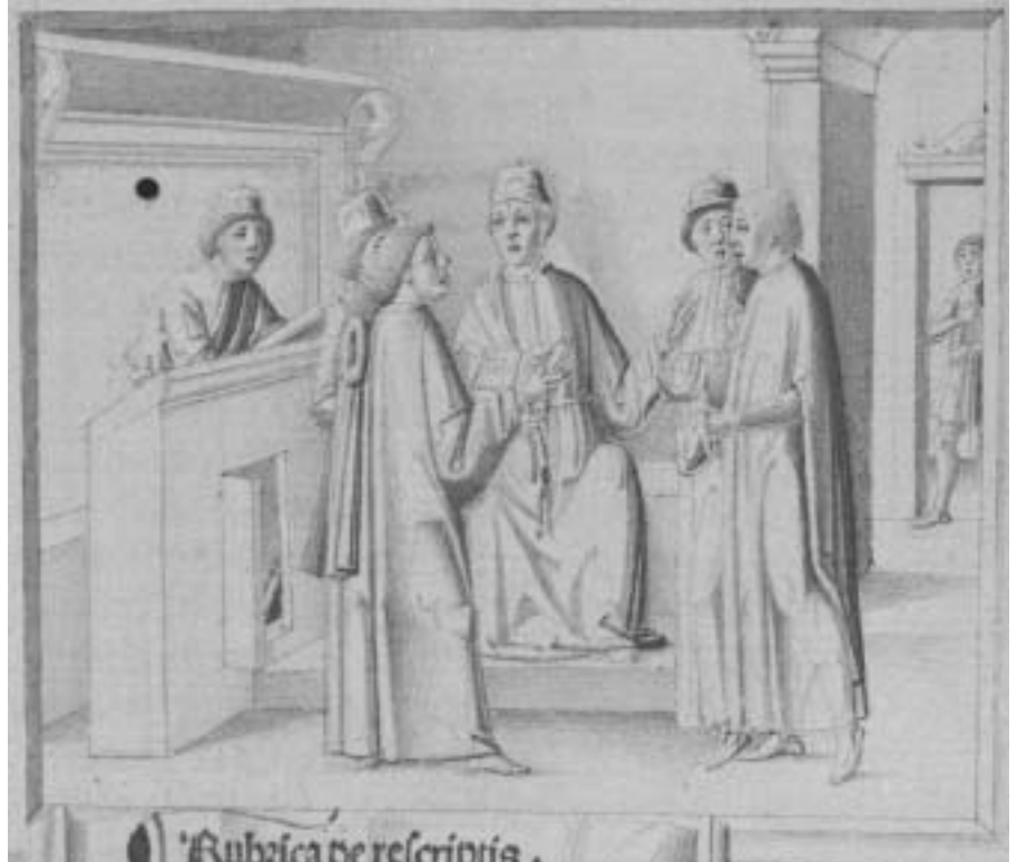
1. Miniatura del XV secolo rappresentante le consegne delle costituzioni papali ai rappresentanti dei docenti e degli scolari. BIBLIOTECA CAPITOLARE DI PADOVA, incunabolo 225.

studenti con la città che li ospitava nel periodo in cui questa, grazie a uno straordinario e prolungato exploit socioeconomico e ad un'irrepetibile lievitazione di coscienza civile, divenne sede di uno stato comunale tra i più influenti e stabili di tutta l'Italia centrosettentrionale e un fervido focolaio di sapere dove mossero i primi passi o si formarono celebrità universali come lo scienziato Pietro d'Abano, il filosofo Marsilio da Padova, lo storiografo e poeta Albertino Mussato, il musicologo Marchetto 4 .