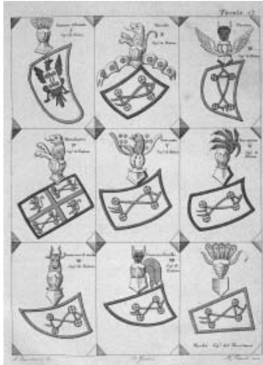
8. Insegne particolari degli otto Signori da Carrara, disegnate da Alessandro Buzzacarini e tratte da GROTTA DELL'ERO, Cenni storici sulle famiglie di Padova e sui monumenti dell'università , vol. II, Padova, Minerva, 1842.

76 FRANCESCO SCIPIONE DONDI DALL'OROLOGIO, Serie cronologico-istorica dei canonici di Padova , Padova, Tipografia del Seminario, 1805, p. 139. La mansio fratrum Alemannorum di Padova, una delle più importanti dell'area mediterranea, costituì fin dal suo sorgere negli anni '40 del Duecento un tramite di continuo afflusso e di smistamento di germanici nella Marca Trevigiana e in Lombardia. Suoi ospiti più o meno occasionali sembrano essere stati, appunto, non pochi scolari, come quei Ludovico fu Ludovico “de Meldinga” e Guglielmo fu Elia “de Namendei theotonicis ... morantibus Padue cum dominis Alemannis” che s'incontrano il 6 ottobre 1311 (ASP, Gesuiti , 133, perg. 14). Di certo vi si riscontrano significative concomitanze: ad esempio una delle famiglie che vi ebbe