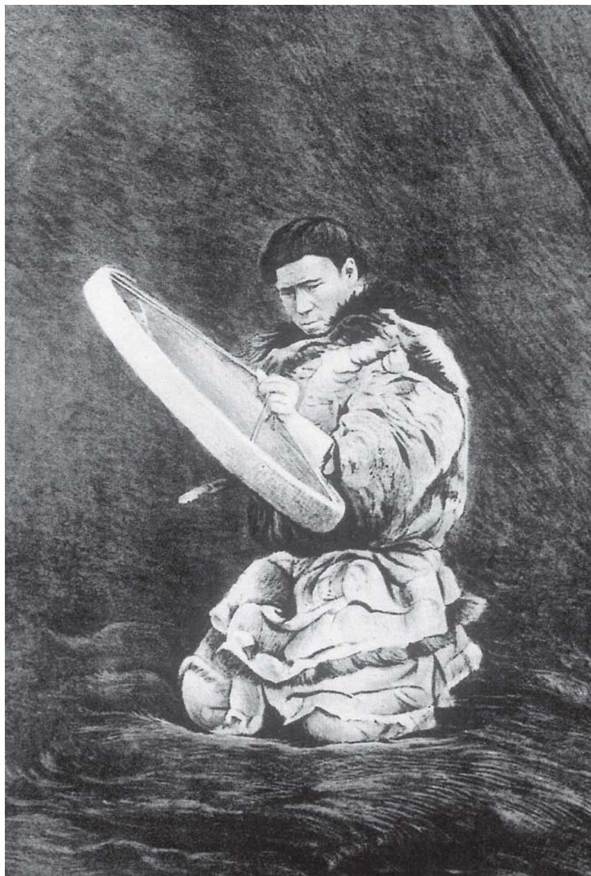
Fig. 1 - Sciamano siberiano (Koriako della Carnèatka), in abiti femminili raduna i fedeli battendo un tamburo. Si osservi l'oscurità del luogo, il suolo appena distinguibile, la strana forma del tamburo e del modo di batterlo. La fotografia originale è stata indubbiamente ritoccata a mano in più punti.