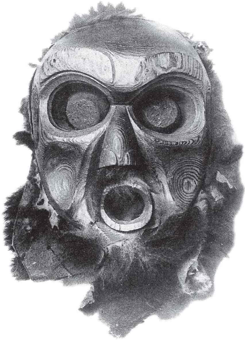
Fig. 4 - Maschera cerimoniale (di legno, peli e setole animali) usata da un "agente del sacro" delle cosiddette Tribù Marittime (Columbia Britannica). La fotografia originale è stata ombreggiata per aumentarne l'effetto tridimensionale.