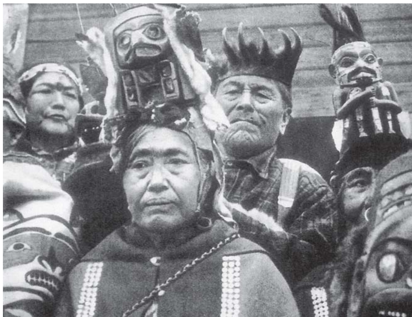
Fig. 2 - Gruppo di Tlinkit. In alcuni dei presenti si rilevano i paludamenti rituali, i copricapi, le statuette lignee intagliate e dipinte, le maschere e gli altri ornamenti liturgici di cui si tratta nel testo.

le spettava, dal momento che la scomparsa del marito era reale e lei dopo tutto non aveva doti di veggente per prevedere i cambiamenti del destino. Inoltre, lei chi stava piangendo prima, quando tra le lagrime aveva scorto la canoa di Qaqatcguk avvicinarsi al porto? Ovvio, il marito scomparso. E adesso riprende il pianto di allora, sentendo che suo «marito» non c'è davvero più: questo Qaqatcguk che è tornato, infatti, e che di primo acchito l'ha resa felice, non si rivela suo marito, il marito che aveva conosciuto, ma altro da lui. Così restiamo nello spirito del racconto.