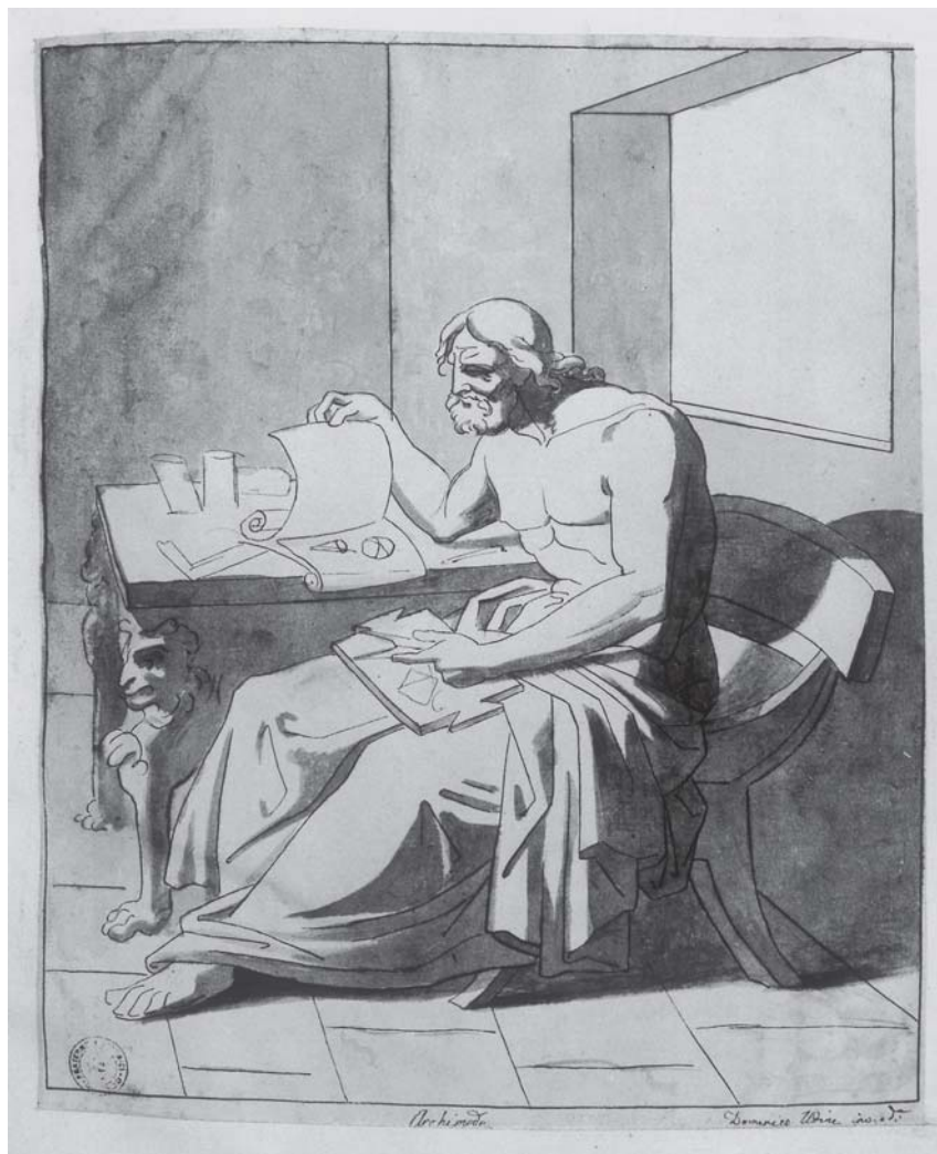
Fig. 4 - DOMENICO UDINE NANI, Archimede , entro il 1815, disegno a penna e inchiostro bruno acquerellato a bistro e seppia su carta bianca vergata con filigrana, foglio, mm 334 x 279 c.; riquadro, mm 301 x 251 c., Arezzo, Fraternita dei Laici, Collezione Bartolini (foglio in taccuino, inv. 2425/III).