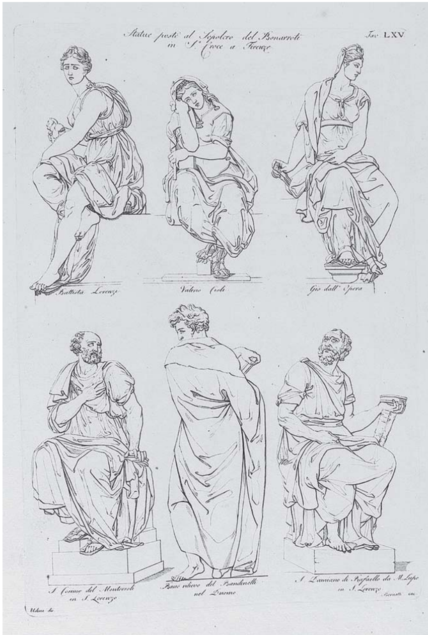
Fig. 3 - [L. CICOGNARA], Storia della Scultura , 1816, Tav. LXV.