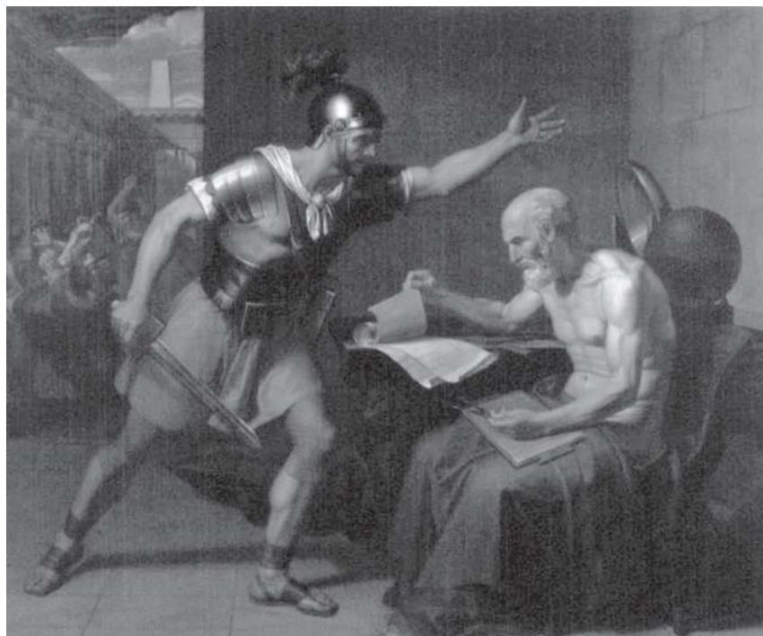
Fig. 6 - DOMENICO UDINE NANI, Uccisione di Archimede , 1815, olio su tela, cm 196,5 x 236, Rovereto, Museo Civico (inv. pin 623).

detta città di Roveredo», di proprietà del Museo Civico di Rovereto è ivi conservato in deposito (inv. pin 623) (39) [Fig. 6]; dal 18 dicembre 2011