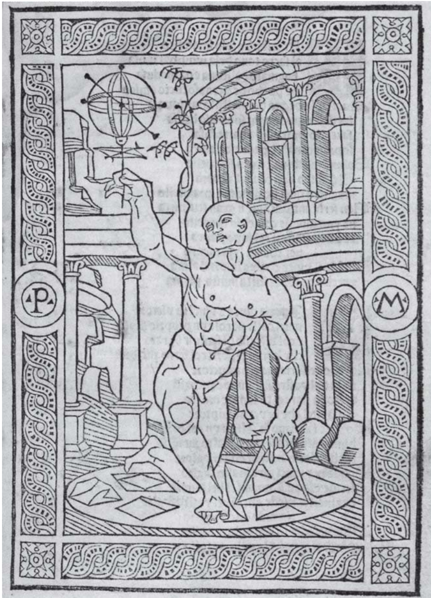
Fig. 7 - ANONIMO (P[ROSPETTIVO?] M[ILANESE?]), Figura nuda inginocchiata con sfera armillare e compasso (dal San Girolamo di LEONARDO), intorno al 1496, silografia del frontespizio delle Antiquarie prospettiche Romane , Roma, Biblioteca Casanatense (Vol. Inc. 1628), p. [1].