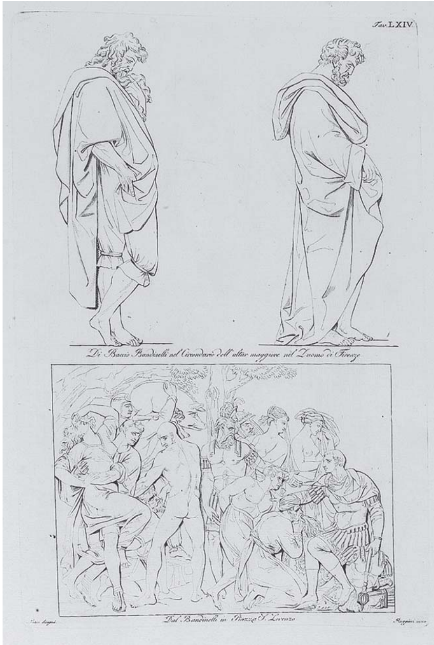
Fig. 2 - [L. CICOGNARA], Storia della Scultura , 1816, Tav. LXIV.