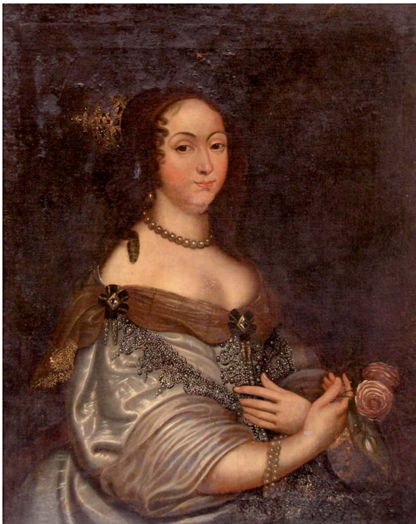
Ritratto di Ludovica Maria Gonzaga Nevers regina di Polonia, Grazie di Curtatone (Mn), Santuario della B. V. delle Grazie, Sagrestia Nuova.