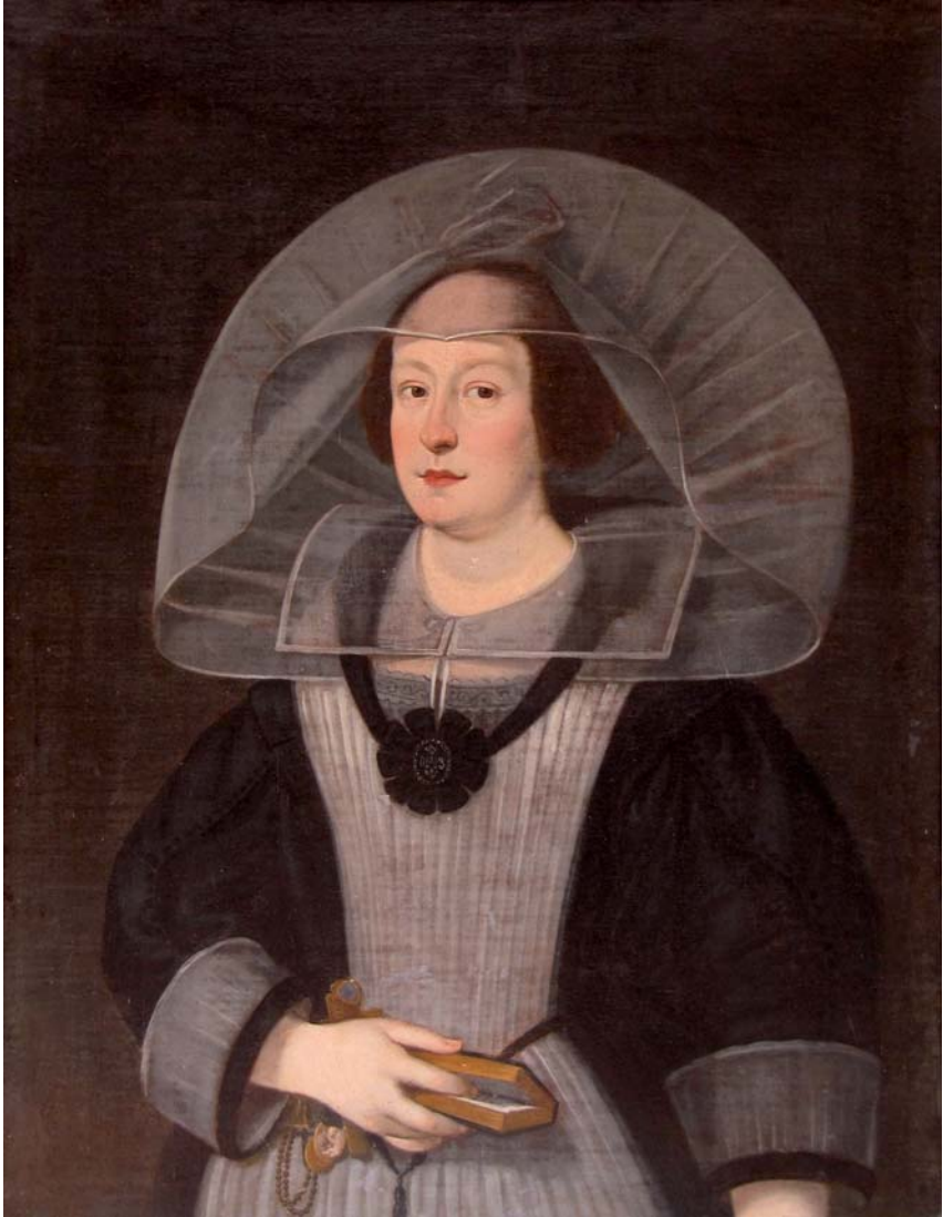
Ritratto di Maria Gonzaga , Grazie di Curtatone (Mn), Santuario della B. V. delle Grazie, Sagrestia Nuova.