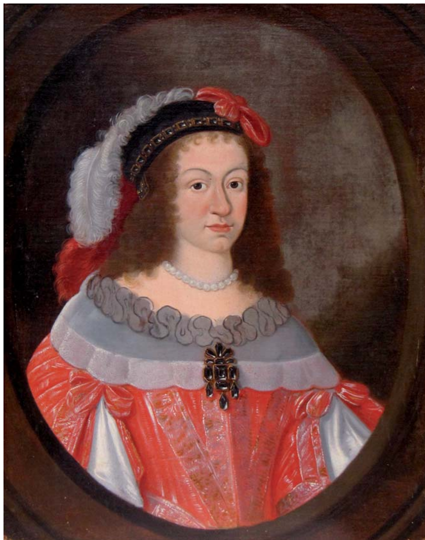
Ritratto di Eleonora Gonzaga Nevers imperatrice, Grazie di Curtatone (Mn), Santuario della B. V. delle Grazie, Sagrestia Nuova.