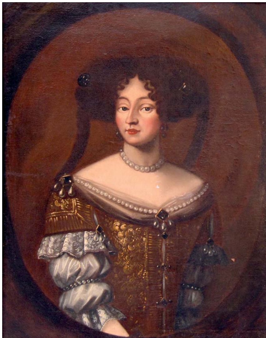
Ritratto di Anna Isabella Gonzaga di Guastalla, Grazie di Curtatone (Mn), Santuario della B. V. delle Grazie, Sagrestia Nuova.