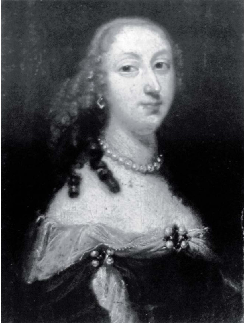
Ritratto di Ludovica Maria Gonzaga Nevers regina di Polonia (?), mercato antiquario.