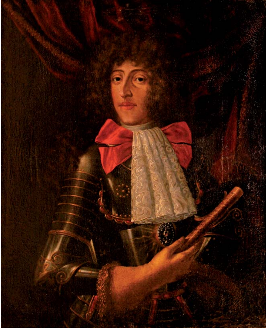
Ritratto di Ferdinando Carlo Gonzaga Nevers, Mantova, collezione privata.