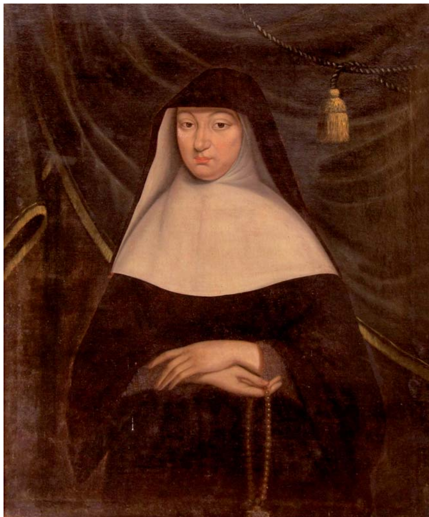
Ritratto di Benedetta Gonzaga Nevers badessa di Avenay-Val-d'Or, Grazie di Curtatone (Mn), Santuario della B. V. delle Grazie, Sagrestia Nuova.