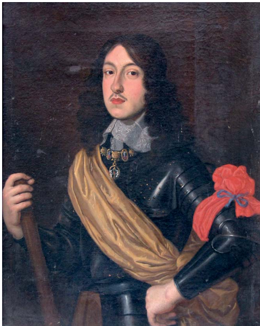
Ritratto di Carlo II Gonzaga Nevers, Grazie di Curtatone (Mn), Santuario della B. V. delle Grazie, Sagrestia Nuova.