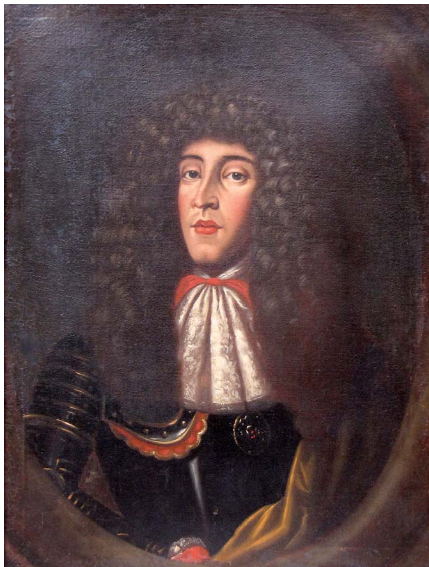
Ritratto di Ferdinando Carlo Gonzaga Nevers, Grazie di Curtatone (Mn), Santuario della B. V. delle Grazie, Sagrestia Nuova.