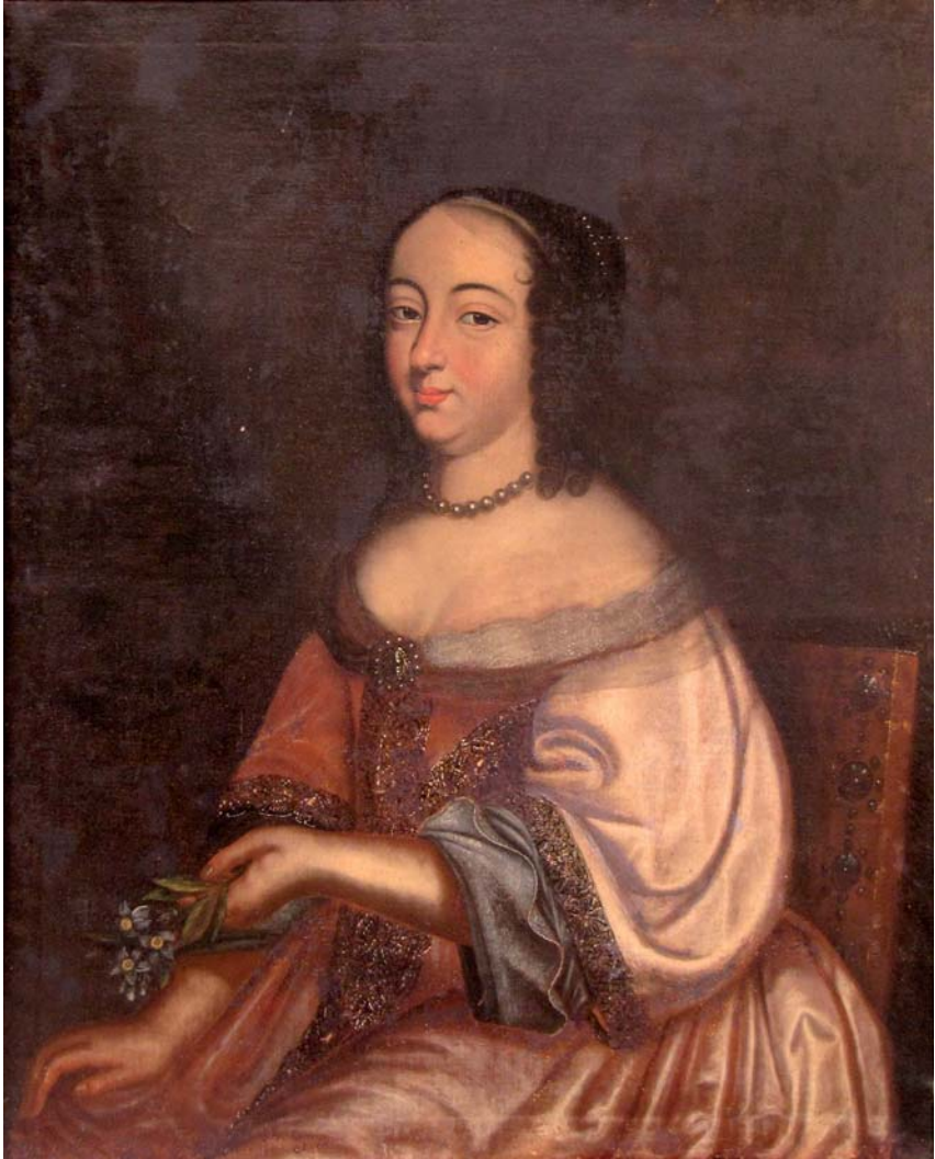
Ritratto di Anna Maria Gonzaga Nevers di Clevès, Grazie di Curtatone (Mn), Santuario della B. V. delle Grazie, Sagrestia Nuova.