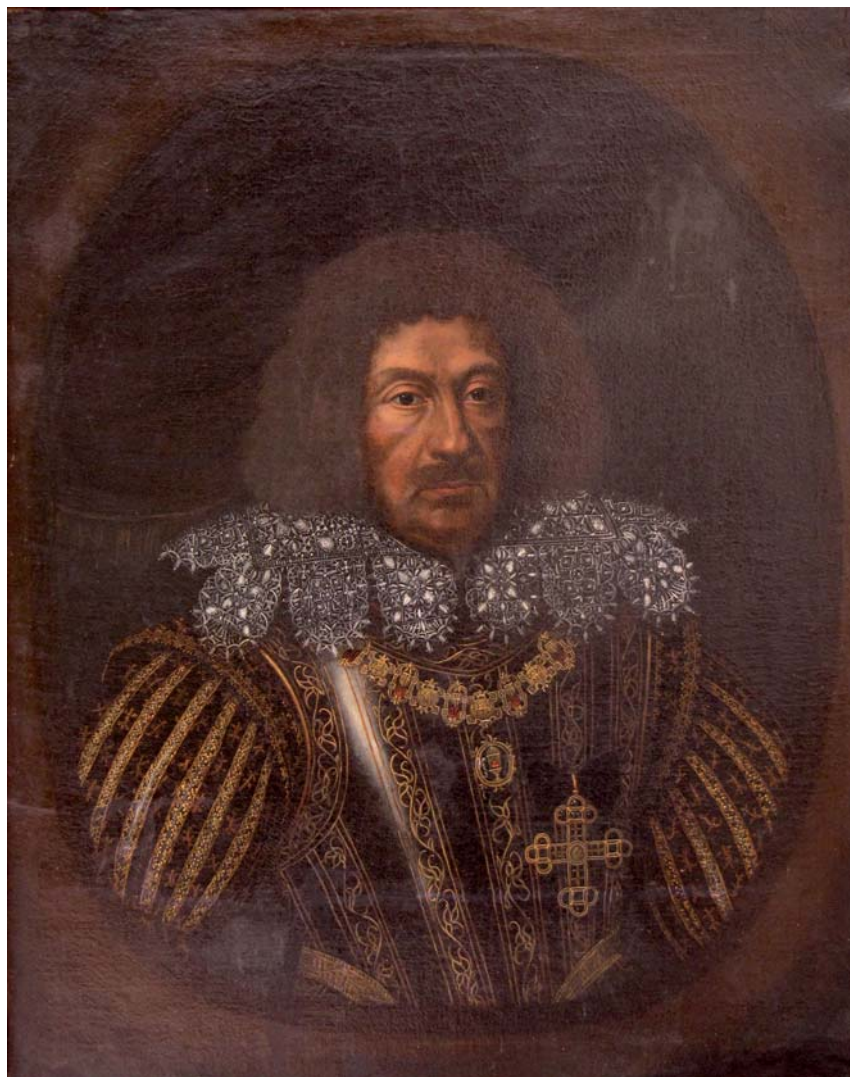
Ritratto di Carlo I Gonzaga Nevers, Grazie di Curtatone (Mn), Santuario della B. V. delle Grazie, Sagrestia Nuova.