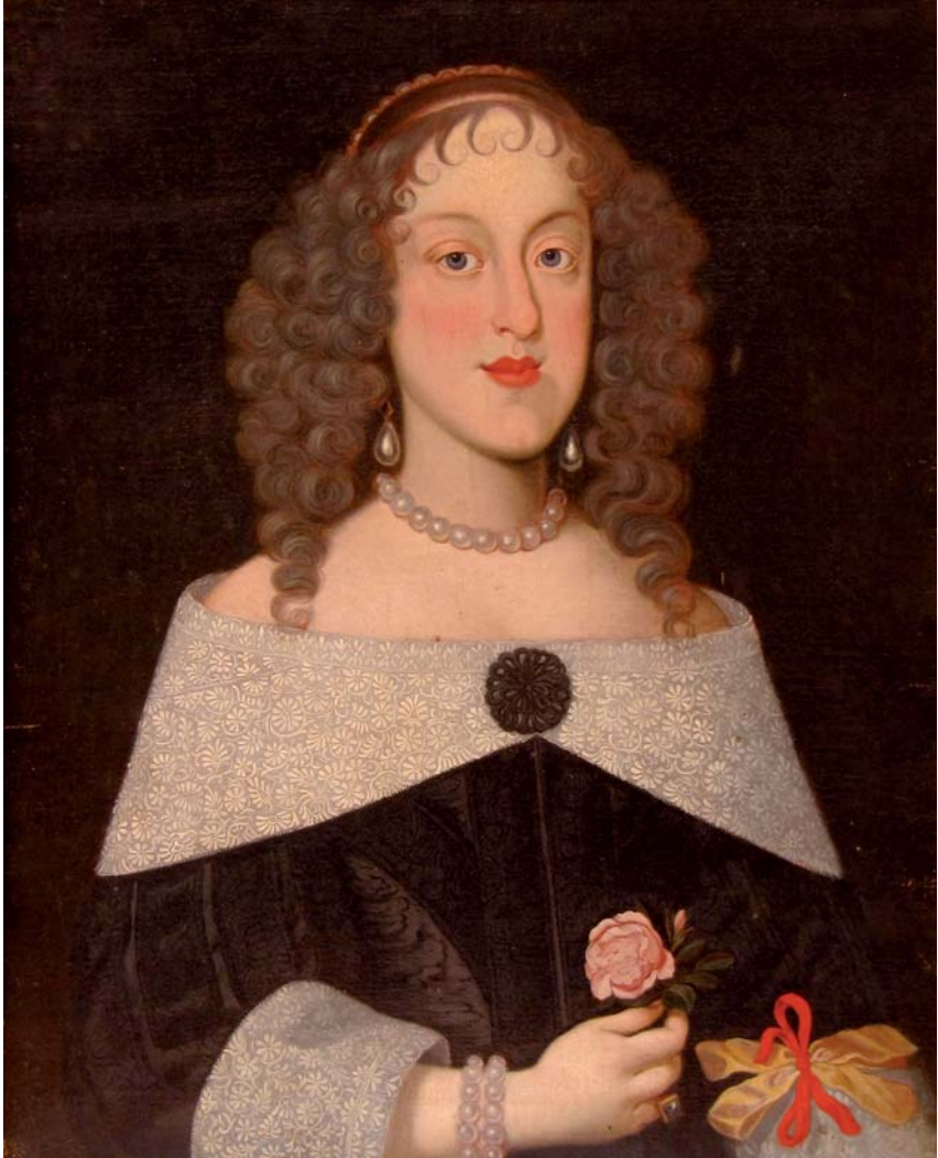
Ritratto di Isabella Clara d'Austria, Grazie di Curtatone (Mn), Santuario della B. V. delle Grazie, Sagrestia Nuova.