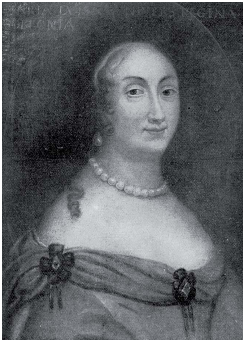
Ritratto di Ludovica Maria Gonzaga Nevers regina di Polonia, esposto alla Mostra Iconografica Gonzaghesca (1937).