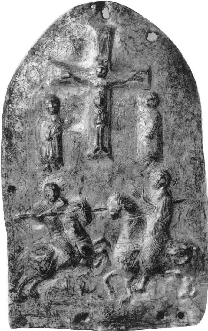
FIG. 1 - Lamina di Adalpreto : lamina in rame dorato, già sulla grata lavorata del sarcofago di Adalpreto (1156-1177); ora nel Museo diocesano (Dimensioni cm. 24,5 x 36,5).