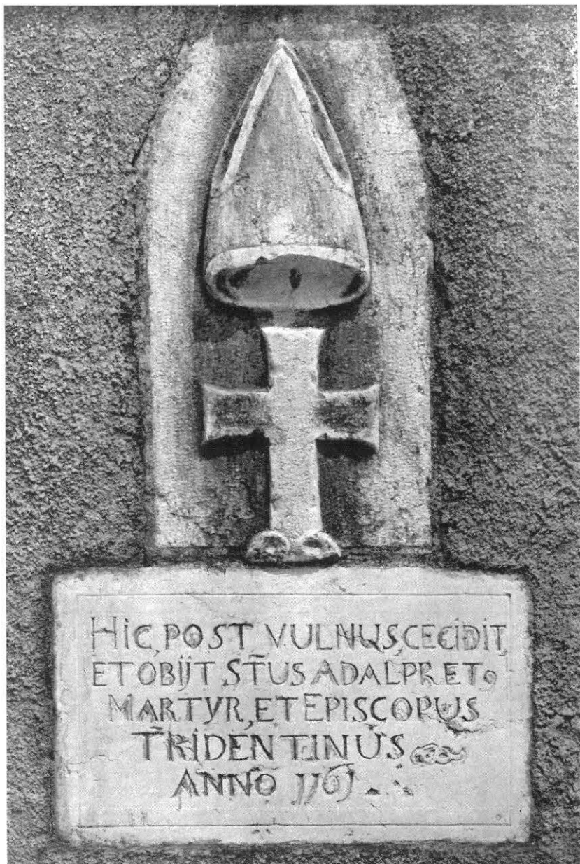
FIG. 5 - Lapi posti nel muro di sostegno del sagrato della chiesa di S. Rocco dei frati francescani di Rovereto.