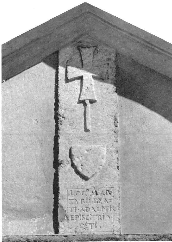
FIG. 2 - L'antica lapide roveretana a ricordo dell'uccisione del vescovo Adalpreto. La lapide è ritenuta della fine del '400. Essa sostituì quindi verosimilmente, altra logorata dal tempo e andata distrutta.