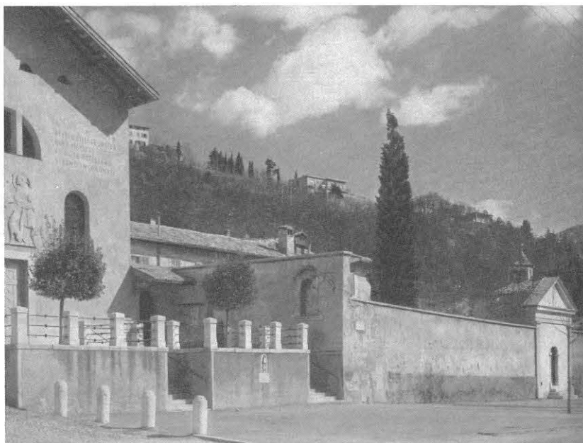
FIG. 3 - Veduta attuale della Chiesa di S. Rocco e Convento dei PP. Francescani. Nel muro di sostegno del terrazzo le lapidi poste verso il 1734 che ricordano l'uccisione del vescovo (con la data errata 1161 invece di 1177).