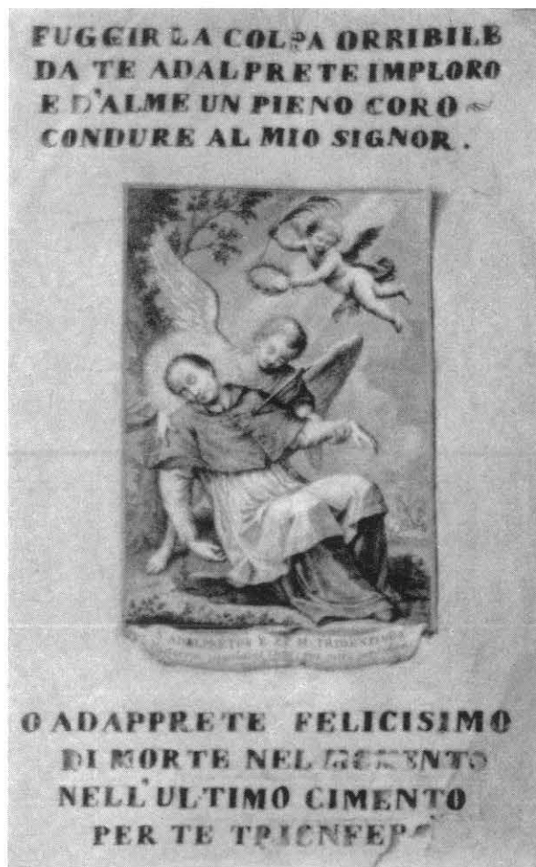
FIG. 7 - Luccisione del vescovo Adalpreto in un disegno di Francesco Zucchi che si trova inserito nelle opere del Bonelli: « Dissertazione intorno alla santità . . . » uscita nel 1754 e « Notizie istorico critiche » del 1760.