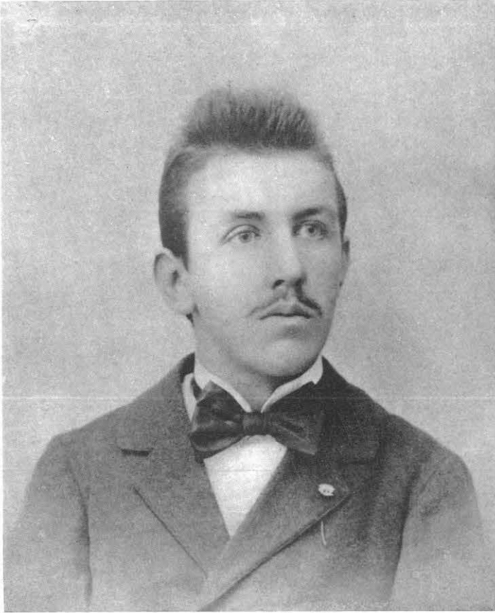
Fig. 3: Fotografia di Zandonai del settembre 1898.