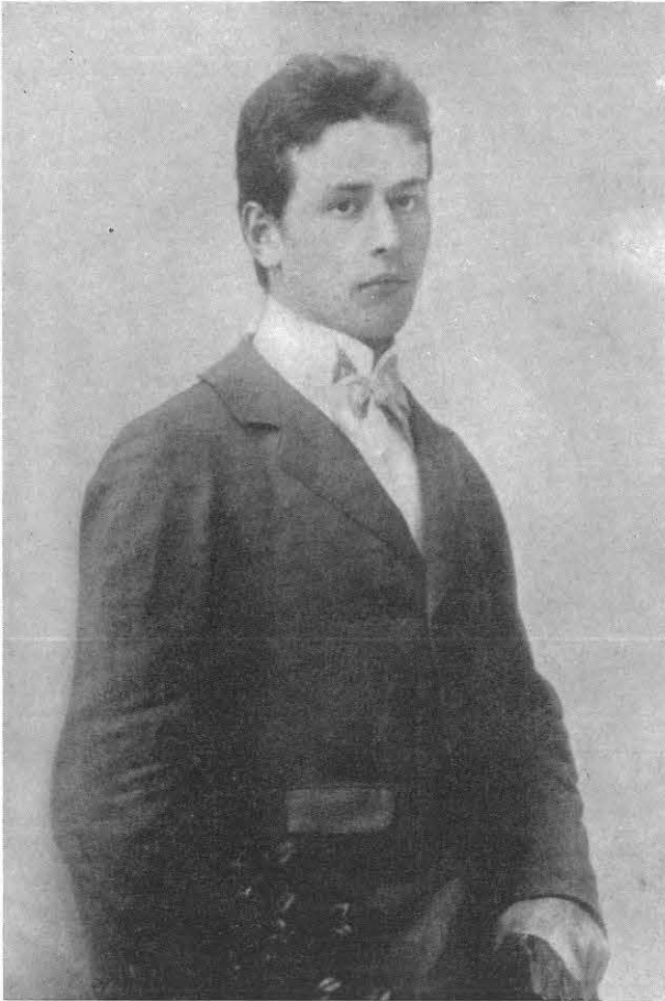
Fig. 4: Fotografia di Leonardi del 1899 o del 1900.