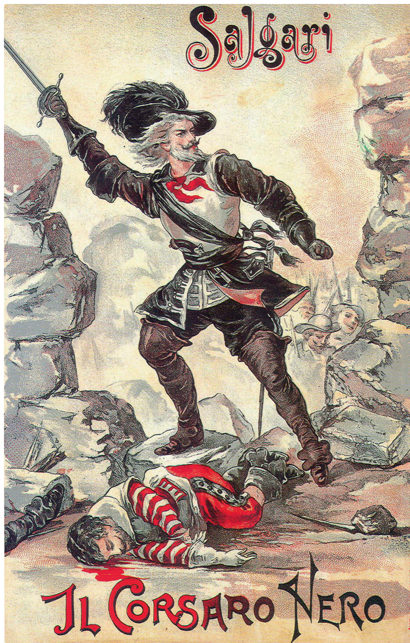
Pipein Gamba, illustrazione di copertina ( Il Corsaro Nero , Donath, 1899).