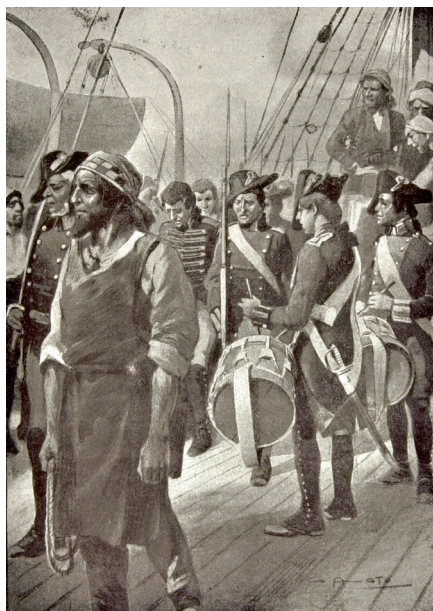
Da sinistra in alto illustrazioni di Alberto Della Valle ( Le due tigri , Donath, 1904; Jolanda, la figlia del Corsaro Nero , Donath, 1904; Le due tigri , Donath, 1904) e di Gennaro Amato ( La crociera della Tuonante , Bemporad, 1910).