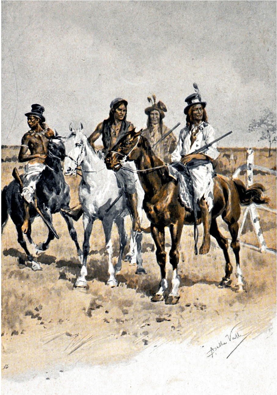
Alberto Della Valle, illustrazione ( La sovrana del campo d'oro , Donath, 1905).