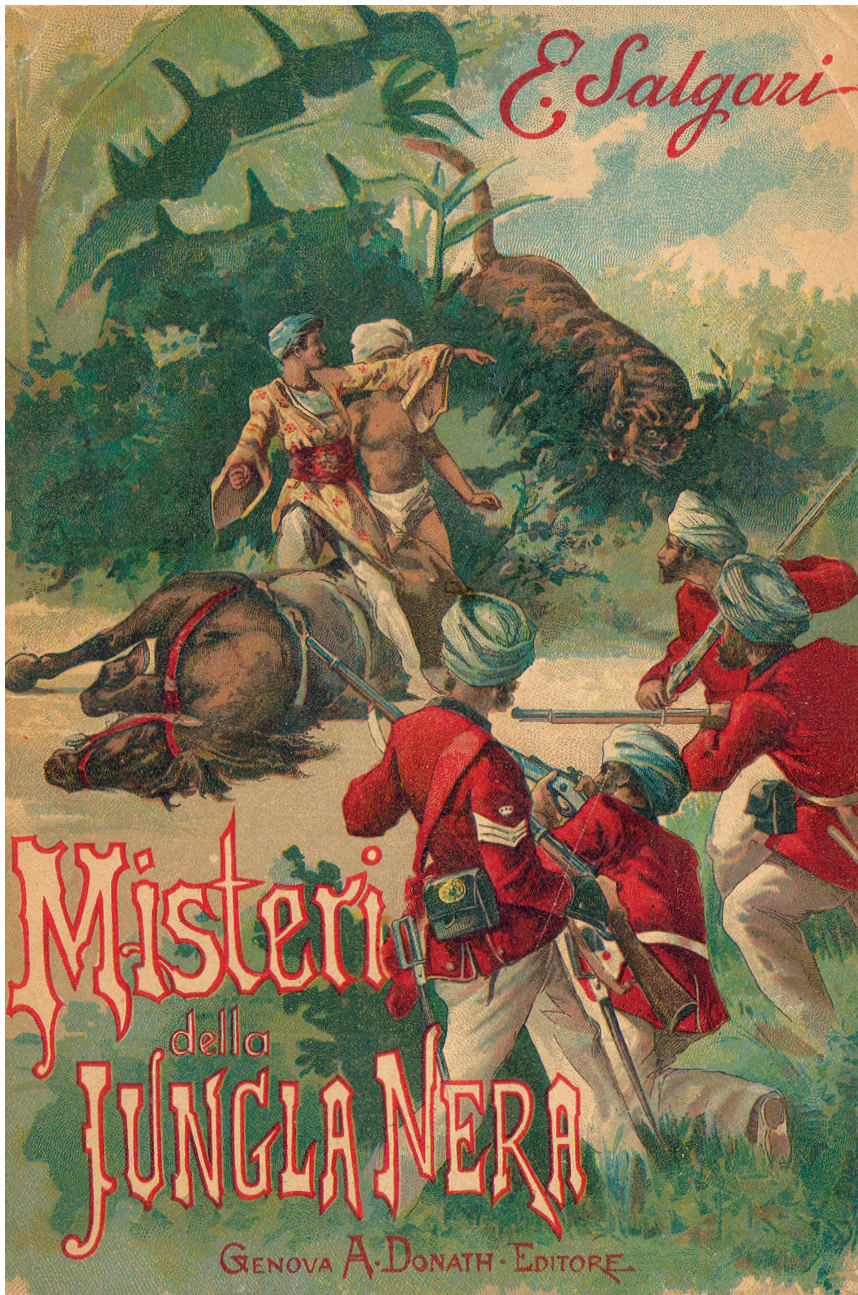
Pipein Gamba, illustrazione di copertina ( I misteri della Jungla Nera , Donath, 1895).