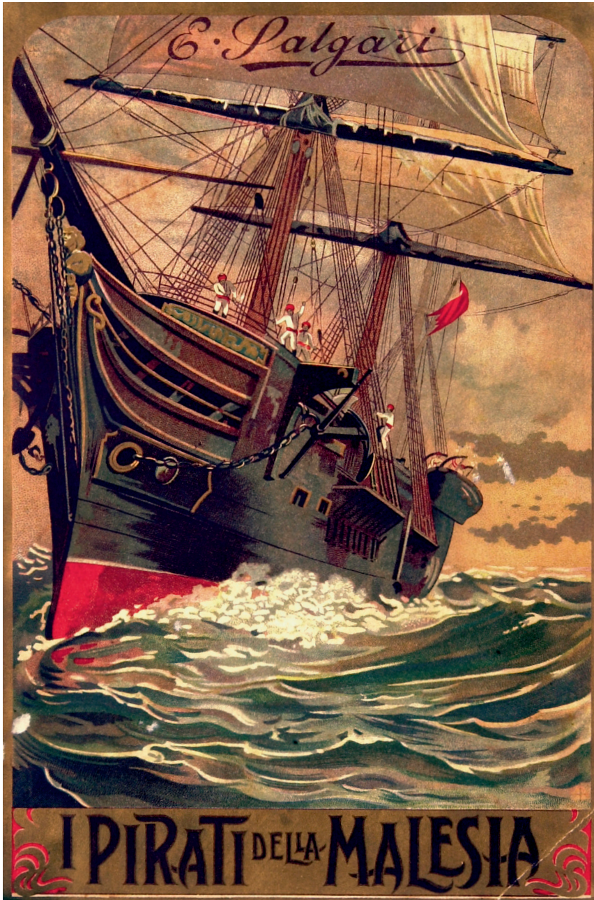
Pipein Gamba, illustrazione di copertina ( I pirati della Malesia , Donath, 1897).