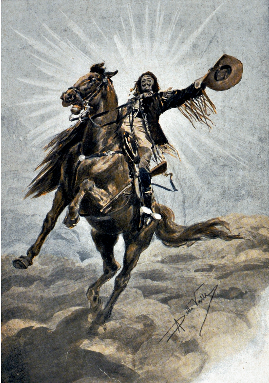
Alberto Della Valle, illustrazione ( La sovrana del campo d'oro , Donath, 1905).