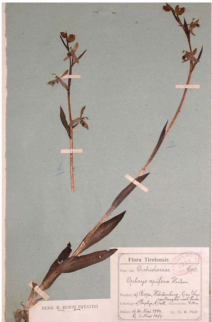
Fig. 5. Foglio HV01-01-11: Ophrys apifera raccolta da W. Pfaff il 30 maggio 1889 al M. Tondo («Hörtenberg») sopra Bolzano [9434/3] e tra Magrè e Penone (Margreid-Pennon) [9633/3*]. La specie è oggi considerata estinta (RE EX ) in Alto Adige/Südtirol.