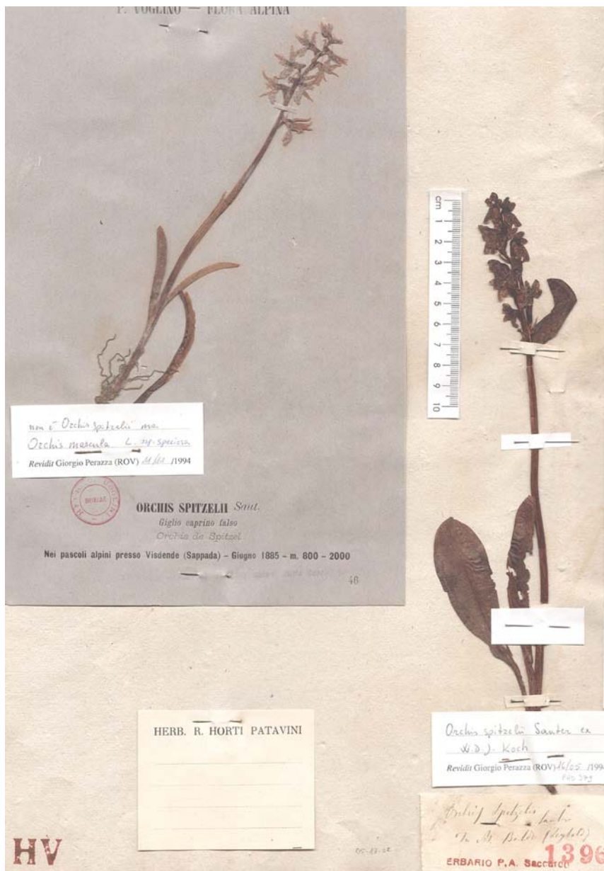
Fig. 12. Foglio HV05-17-02: a destra esemplare di Orchis spitzelii proveniente dall'erbario di P.A. Saccardo, raccolto da F. Leybold sul M. Baldo [località non precisata e senza data] verosimilmente alla Colma di Malcesine [0231/1] il 3 luglio 1854 durante il suo viaggio ai confini dell'allora Tirolo meridionale. L'esemplare a sinistra, raccolto da P. Voglino sopra Sappada in provincia di Belluno, non è O. spitzelii ma O. mascula subsp. speciosa .