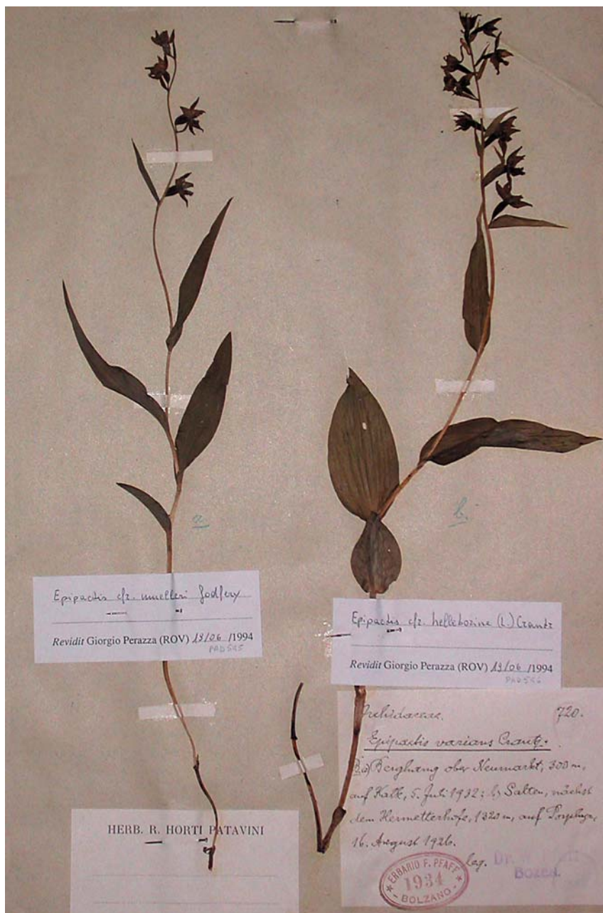
Fig. 3. Foglio HV15-10-02: Epipactis sp. dell'erbario di W. Pfaff da lui determinati come E. varians Crantz (= E. purpurata Smith, E. viridiflora Hoffm. ex Krock.); a sinistra l'esemplare raccolto il 5 luglio 1932 sopra Egna (Neumarkt) [9633/4], a destra quello raccolto il 16 agosto 1926 presso S. Genesio (Jenesien) [9433/4].