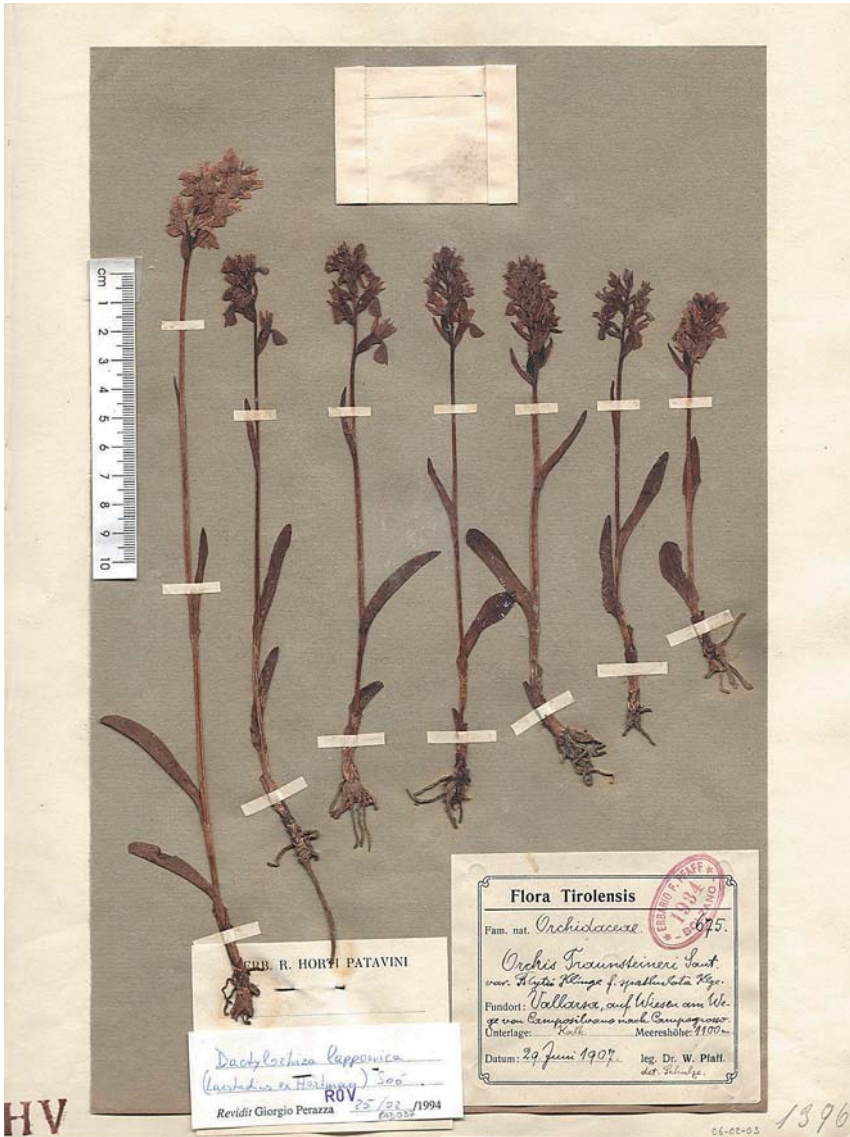
Fig. 11. Foglio HV06-02-03: Dactylorhiza lapponica subsp. rhaetica raccolta da W. Pfaff il 29 giugno 1907 tra Camposilvano e Campogrosso in Vallarsa [0232/2]. Si evidenzia la variabilità nell'altezza degli esemplari che varia da 11,5 a 28 cm, sicché il maggiore appare più simile a D. traunsteineri mentre gli altri 6 sono chiaramente D. lapponica . Situazioni simili si riscontrano in parecchie stazioni in regione.