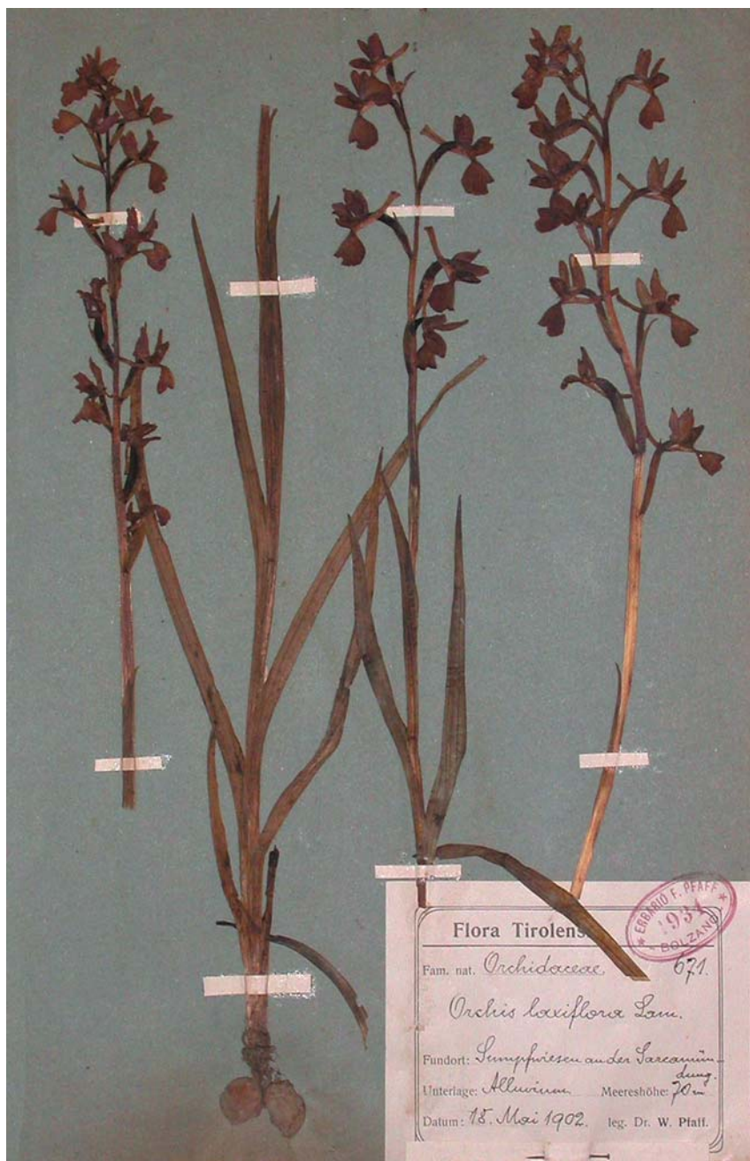
Fig. 10. Foglio HV02-03-03 con 3 esemplari di Orchis laxiflora raccolti da W. Pfaff il 18 maggio 1902 all foce del Sarca [0131/1]. La specie è oggi estinta in Trentino.