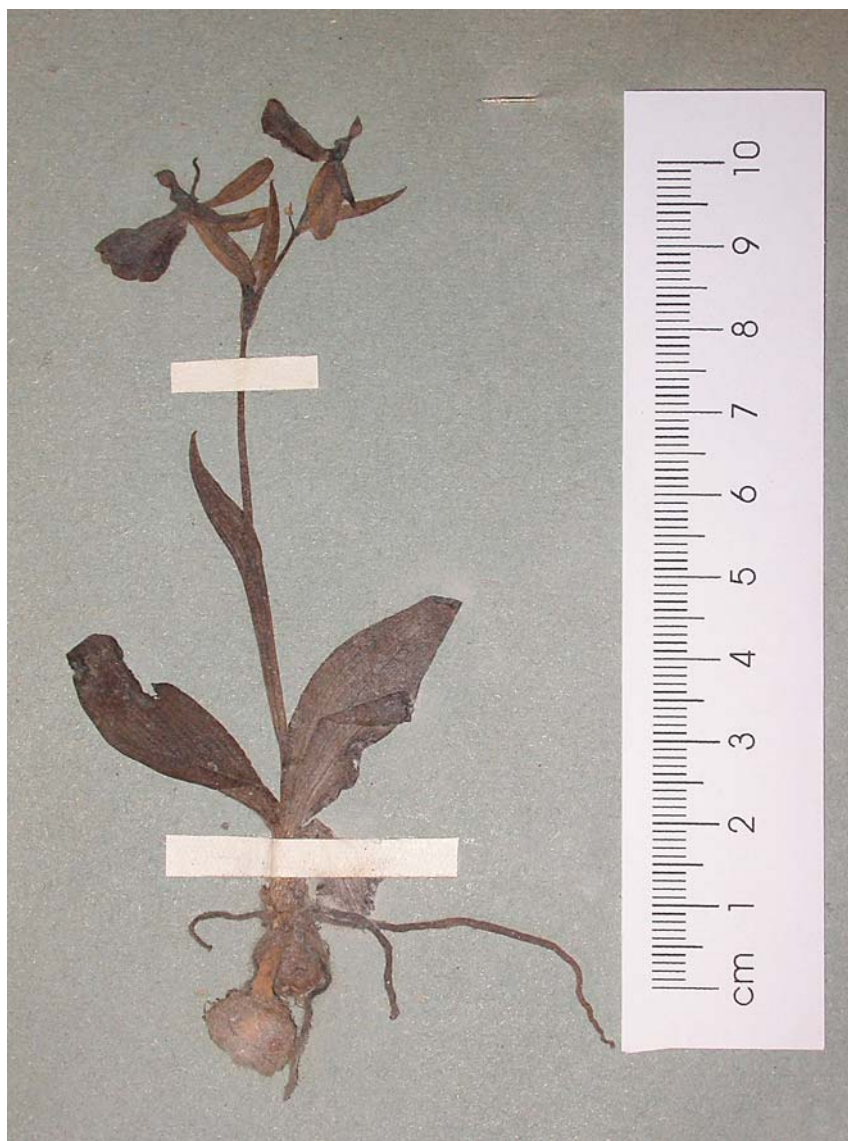
Fig. 6. Foglio HV01-08-03: Ophrys bertolonii subsp. benacensis raccolta da W. Pfaff al «Galgenbichl» presso Salorno [9733/3], unica testimonianza della passata presenza di questa specie in provincia di Bolzano dove oggi è considerata estinta (RE EX ). Sul cartellino è scritto «Orchidaceae, 689. Ophrys Bertolonii Moretti. B. Salurn: an der Strasse oberhalb des Galgenbichls, 240 m, auf Kalkschotter; 18. Mai 1930, leg. Dr. W. Pfaff» con timbro «Erbario F. Pfaff, Bolzano, 1934» (cf. fig. 1).