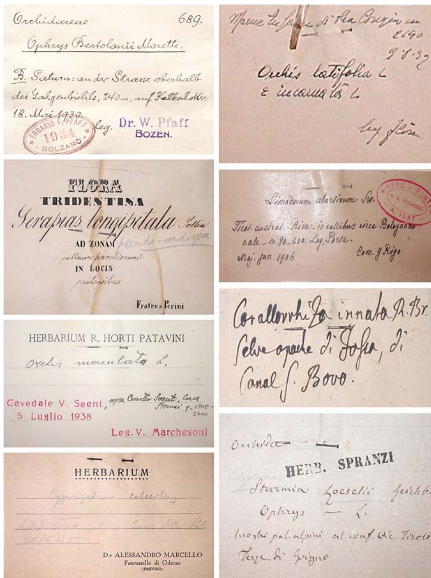
Fig. 1. Esempi di cartellini in Herbarium Venetum (ridimensionati). Autori sono: W. Pfaff, A. Flöss, A. & C. Perini, G. Rigo, V. Marchesoni, Anonimo (F. Fachini?), A. Marcello e A. Spranzi.