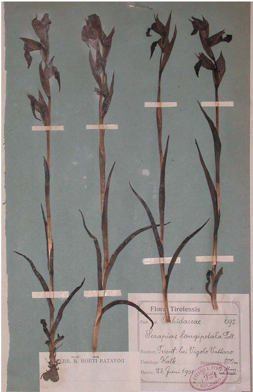
Fig. 8. Foglio HV07-04-02: Serapias vomeracea proveniente dall'erbario di W. Pfaff, raccolta il 23 giugno 1901 da J. Murr a Vigolo Vattaro [9933/3] dove la specie, allora abbondante, è oggi scomparsa per le trasformazioni ambientali.