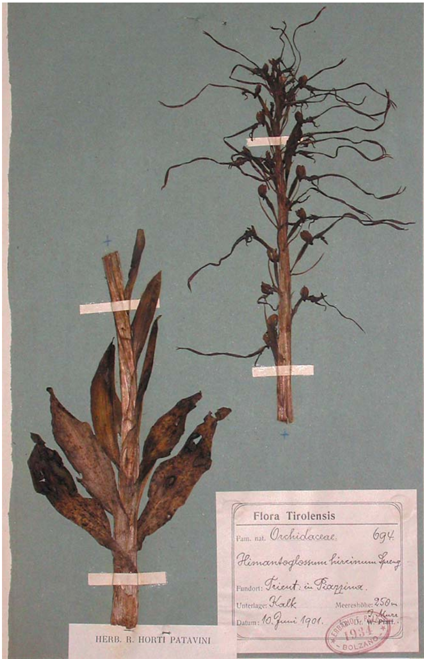
Fig. 7. Foglio HV07-08-08: Himantoglossum adriaticum proveniente dall'erbario di W. Pfaff, raccolto da J. Murr a Piazzina [9932/2]; la località è oggi inglobata nel tessuto urbano di Trento e qui la specie è scomparsa.