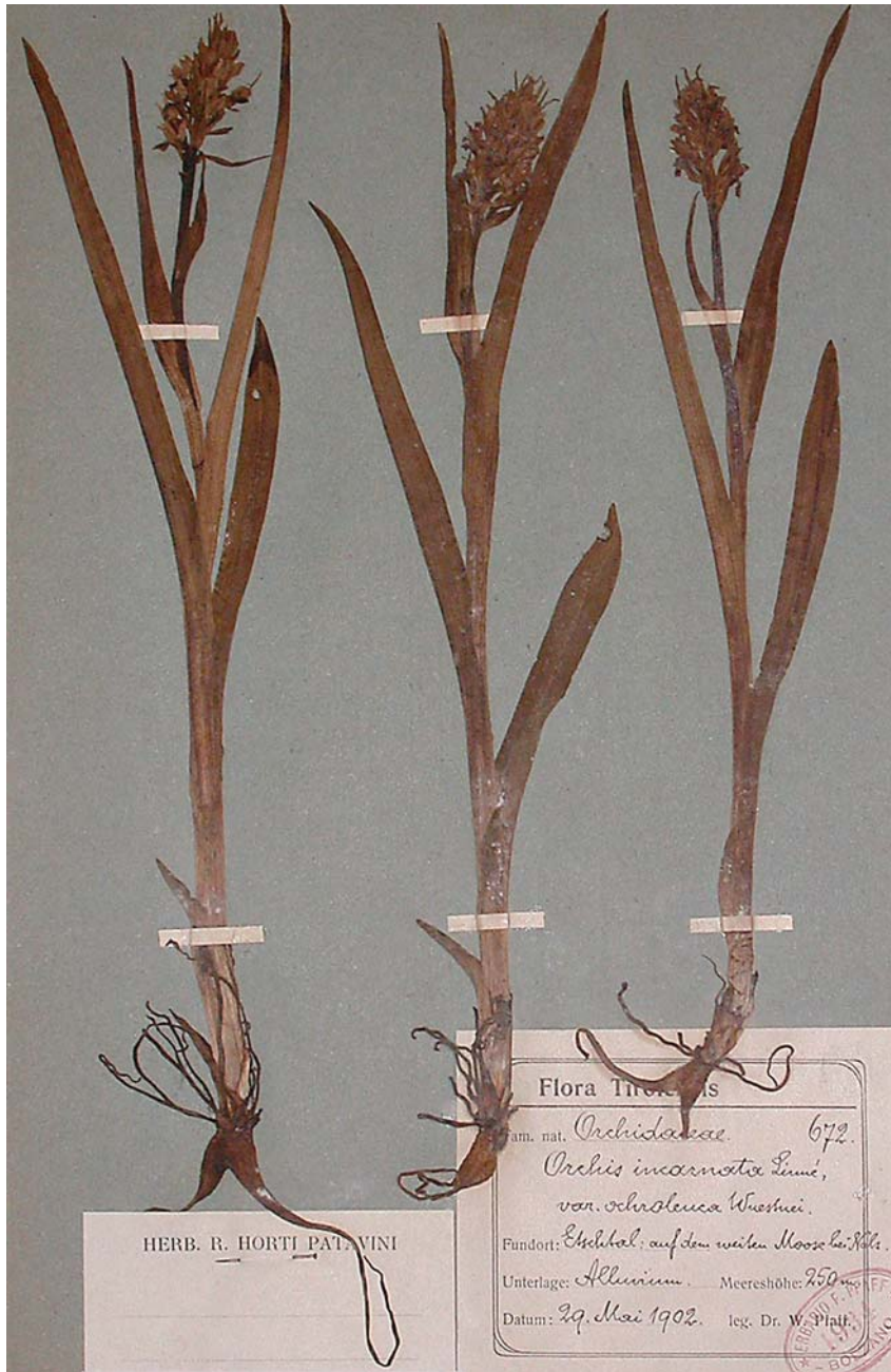
Fig. 2. Foglio HV02-07-01: esemplari di Dactylorhiza incarnata cf. f. ochrantha (sub Orchis incarnata Linné var. ochroleuca Wuestnei) raccolti da Pfaff il 29 maggio 1902 alla Palù Grande (Weiten Moose) tra Nalles e Andriano (Andrian) [9433/3].