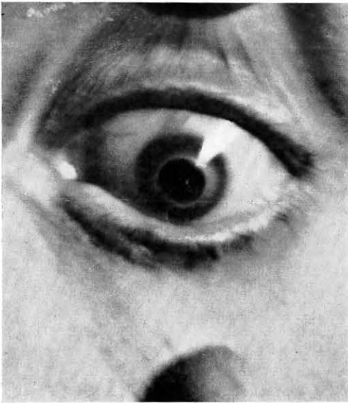
Fig. 1 b