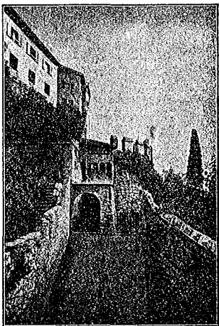
Ingresso al Castello

Dopo la salita dell' androna, lungo la quale sono allineati cannoni e bombarde di preda bellica di vari tipi e di vari calibri, il visitatore si trova nel suggestivo cortile interno limitato dalle mu-