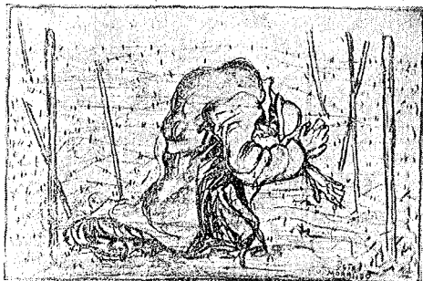
Reticolato della morte

Questo diario tutto speciale, ora altamente tragico, ora sentimentale, ora buffo lo troviamo esposto in 170 opere, l'una accanto all'altra, in una grande bella sala (metri 20 x 8) appositamente costruita per contenere tanto valore artistico materiale e spirituale, nel Museo della Guerra di Rovereto.