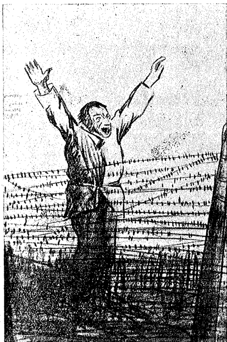
'Austriaco impazzito che si arrende

Qui e lì ritratti di compagni d'arme, quanto mai caratteristici, la lotta per sfondare reticolati nemici, visi di soldati nostri e di prigionieri che sembra vogliano parlare.