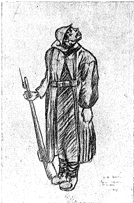
Passa l'aereo nemico

vissero, soffrirono, subirono quelle orgie di fuoco, di granate e di scoppi, che lasciarono brandelli delle loro carni in quell'inferno grandioso, terribile, e riprodotto con tanta sdolcinata leggerezza.