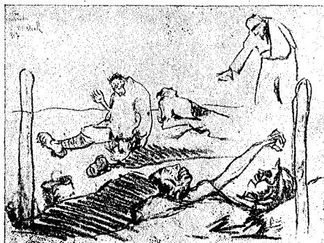
Sul San Michele

1) Molti, troppi, sono i reduci che nella falsariga degli autori nominati tentarono di descriverci la guerra quale è realmente. Ma le loro pubblicazioni molto hanno di rimarchevole, cadono anzi nel banale, nel plagio, puzzano da volgare speculazione libraria, in qualche caso cadono nell'irreale, stancano . . .