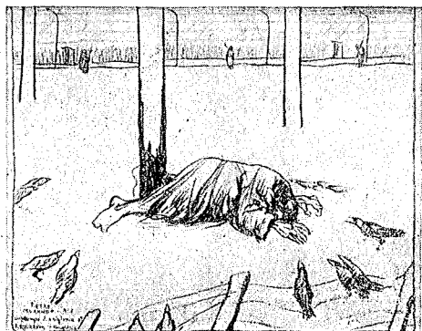
Tormento (dalla prigionia)

4. I duri giorni della prigionia , con la lotta per un tozzo di pane che sarà la vita per un giorno ancora; alla ricerca della buccia fra le luride spazzature; scene da conte Ugolino, pali di punizione, austriaci carnefici, vedute d'insieme dei campi di prigionia.