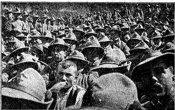
I soldati durante la rappresentazione

Il soggetto della commedia era sempre lo stesso: La caduta di un sultano . Faceva seguito una farsa brillante nella quale comparivano Guglielmo II imperatore di Germania e Carlo I imperatore d'Austria. I due compari tramavano ai danni di Marianna (Francia), una bella forosetta