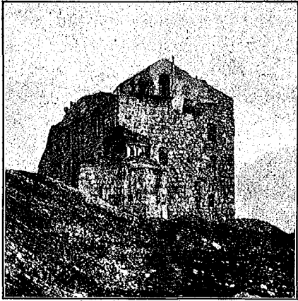
Forte Prato di Piana