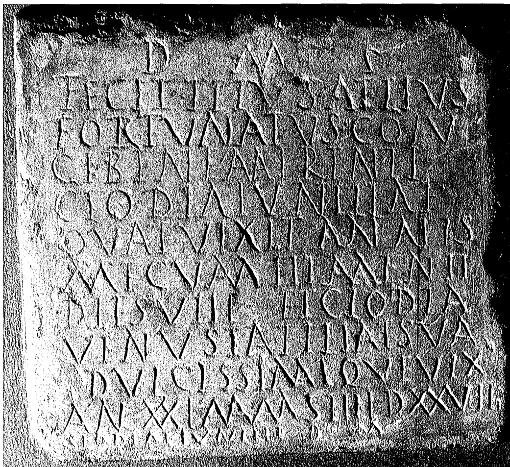
TAV. I - Epitafio urbano da collezione privata del Maceratese.