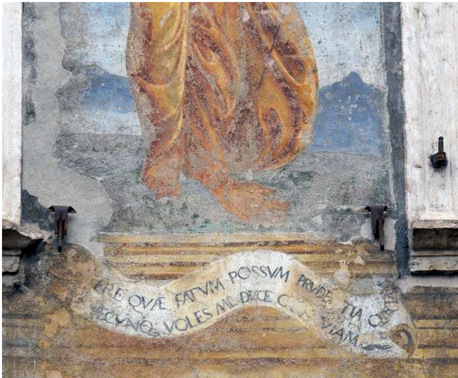
■ 10. Trento, piazza del Duomo, casa Olivieri (dettaglio)