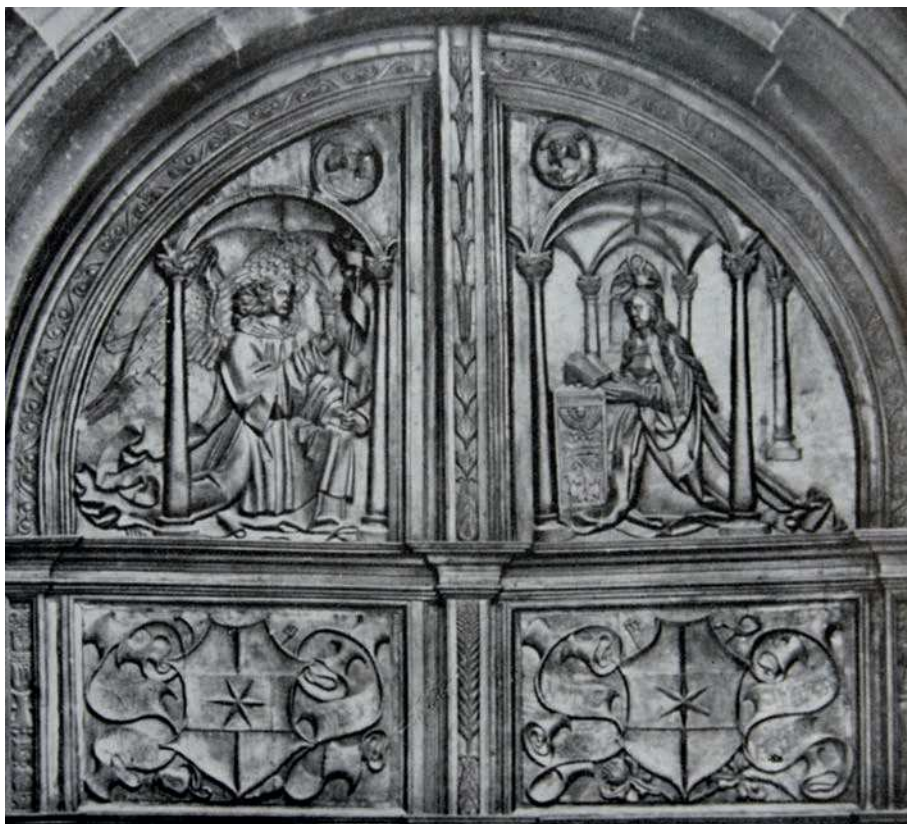
■ 17. Bolzano, duomo, battenti lignei del portale maggiore, 1521, fotografia storica prima del bombardamento del 1944

gelisti e con lo stemma della città di Bolzano ripetuto due volte (figg. 15-19); opera molto danneggiata nel bombardamento che il 13 maggio 1944 colpì seriamente la chiesa 40 .