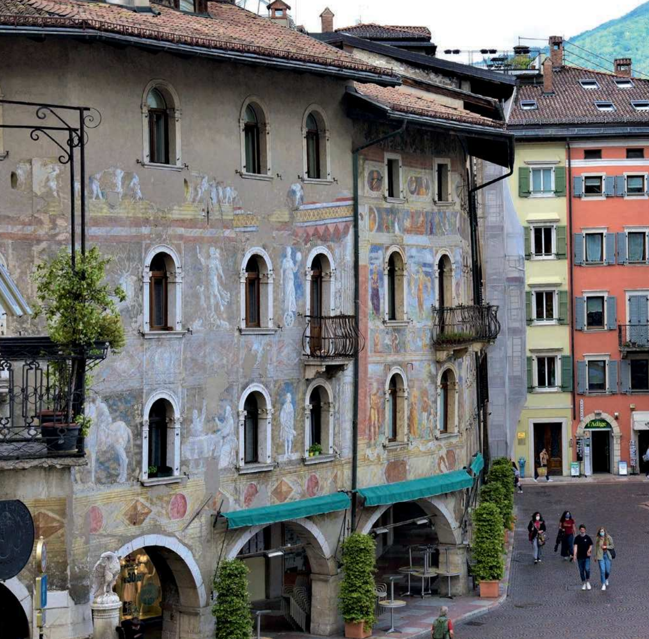
■ 6. Trento, piazza del Duomo, le case Gelpi e Olivieri

tramandava memoria di una disastrosa alluvione dell'Adige (chiamato "Diessa") nel 1513 8 . Non manca naturalmente un riferimento alla chiesa di Santa Maria Maggiore come celebre "luogo del concilio" che, afferma l'au-