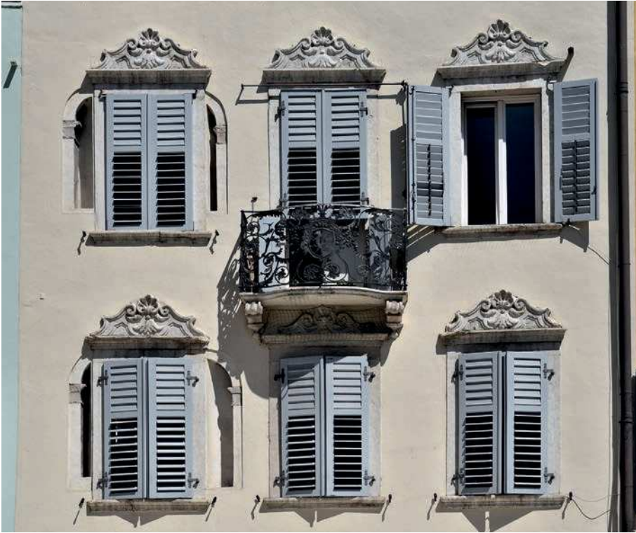
■ 12. Trento, piazza del Duomo, casa de Negri di San Pietro, lato verso settentrione (dettaglio)

Le seguenti iscrizioni riportate dall'autore sono ancora oggi visibili rispettivamente sulla casa Gelpi e su quella contigua degli Olivieri: " Nemo ante obitum felix est. Gratia animi propensione non re metienda aliquid mali propter vicinum malum. Quis felix qui timere non desinit. De colore non iudicat caecus " 21 . Inoltre, su casa Olivieri: " Qui Mercator eram dives, nunc dicor egenus. Dum nec quod tulit hic prestat et ille negat. Nubila discutunt data dona et fluminis 22 iram / Iratos flectunt et data dona deos. Vivere quae fatum possum prudentia certam. In quaecunque 23 voles me duce carpe viam. Cuncta mihi suspecta noto quaecumque 24 dolendi. Materiam quero 25 hinc in