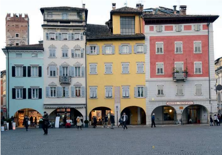
■ 11. Trento, piazza del Duomo, lato verso settentrione

quella cinquecentesca, che sembra imitare finti marmi 13 . Preziosa testimonianza quindi, seppur frammentaria, di una casa rinascimentale dipinta andata perduta e finora sfuggita agli studiosi.