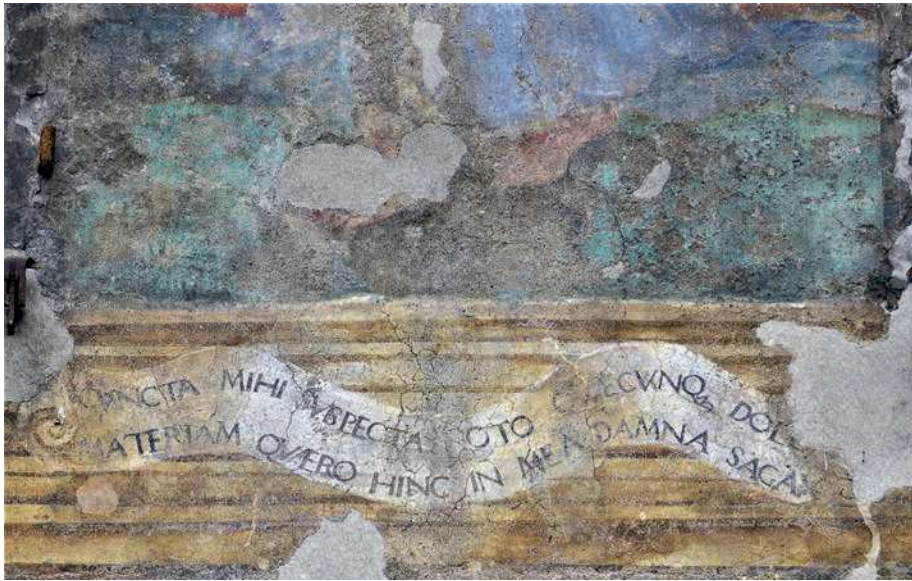
■ 9. Trento, piazza del Duomo, casa Olivieri (dettaglio)