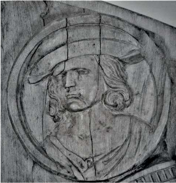
■ 19. Bolzano, duomo, battenti lignei del portale maggiore, 1521, stato attuale dopo il restauro. Bolzano, Museo Civico

Per quanto riguarda Innsbruck, “belle et petite ville Imperiale” di cui ricorda “les maisons en plus part peintes par dehors” 42 , l’attenzione va in primo luogo a due case dipinte che purtroppo sono andate perdute. La prima era dedicata a Rodolfo I d’Asburgo e mostrava immagini di altri re e imperatori, mentre sulla seconda era presente un tema assai importante nel Cinquecento