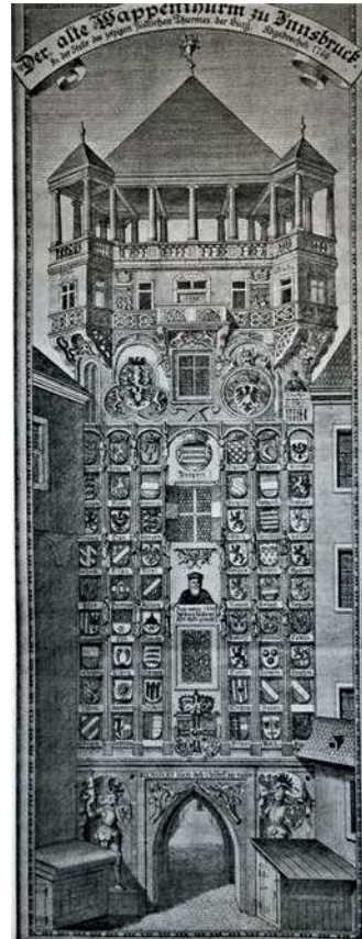
■ 20. C. Redlich, S. Kleiners, Der alte Wappenturm zu Innsbruck [...] Abgebrochen 1766 , litografia

per la valenza politica antifrancese: una grandiosa raffigurazione della battaglia di Pavia, che nel 1525 segnò la sconfitta del Regno di Francia con la cattura del re Francesco I da parte dell'esercito imperiale 43 . Inoltre, il cenno al palazzo “sompstueux et superbe ou le frère de l'Empereur 44 tient sa court et residence” – ossia, come è verosimile, alla residenza fatta ampliare e abbellire dal re Ferdinando I – non può non suscitare rimpianti, essendo andata distrutta 45 . Buona parte della descrizione di Innsbruck è dedicata al grandioso monumento funebre dell'imperatore Massimiliano I nella chiesa dei Francescani (l'odierna Hofkirche ). Le Monnier descrive poi con grande ammirazione il Wappenturm (fig. 20) ossia la porta-torre “degli stemmi”, decorata nel 1496 per volere di re Massimiliano I d'Asburgo che recava, fra l'altro, le immagini di 54 stemmi, opera del pittore di corte Jörg Kölderer; il grandioso apparato ornamentale rappresentava il programma politico e territoriale degli Asburgo sul finire del Quattrocento. Fu demolita dopo la metà del Settecento quando venne ricostruito l'adiacente palazzo imperiale per iniziativa di Maria Teresa; fortunatamente venne documentata da incisioni settecentesche e nel 1777, da ultimo, dal pittore Matthias Perathoner 46 .