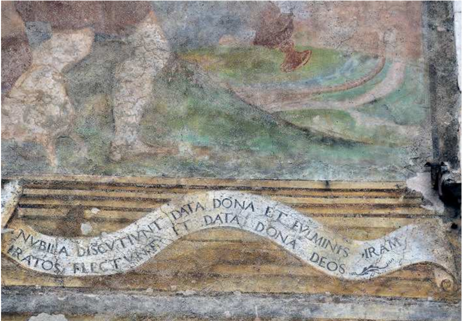
■ 8. Trento, piazza del Duomo, casa Olivieri (dettaglio)