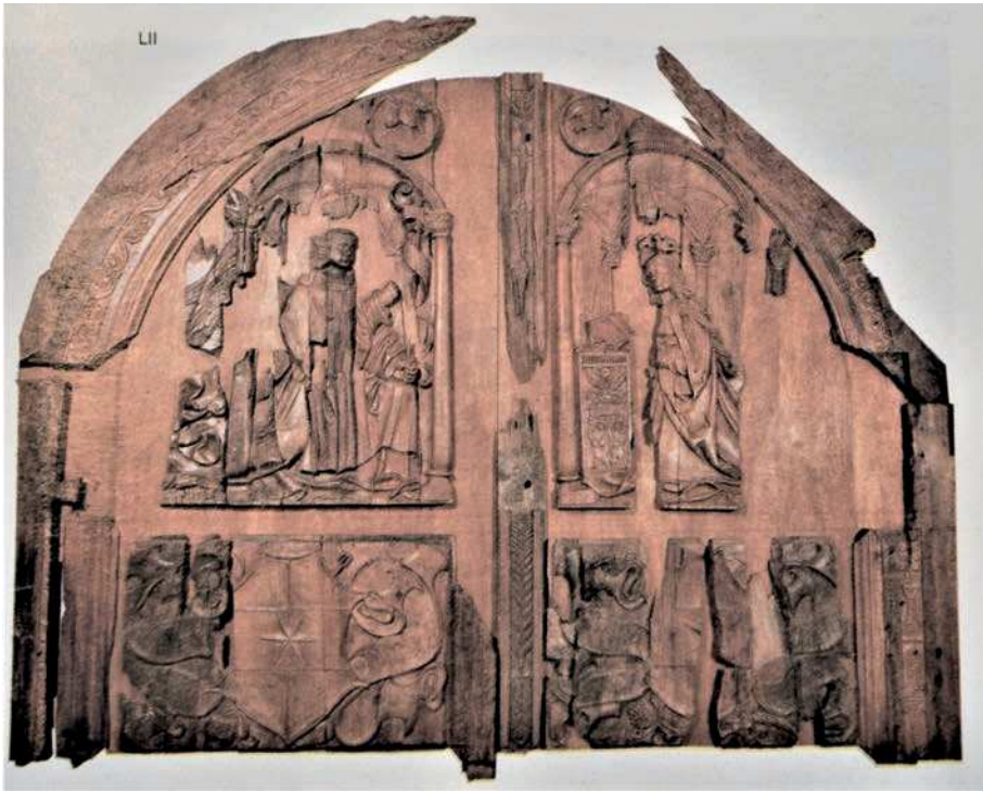
■ 18. Bolzano, duomo, battenti lignei del portale maggiore, 1521, stato attuale dopo il restauro. Bolzano, Museo Civico

Nell'area tirolese la tappa successiva del viaggio è Innsbruck, città alla quale vengono dedicate ben sette pagine. Sulla strada per Innsbruck, alla distanza di quattro miglia tedesche dalla città, Le Monnier segnala con risalto un monumento di bronzo eretto a ricordo dell'incontro tra l'imperatore Carlo V e il fratello Ferdinando, qui avvenuto nel 1530, come attesta una lunga iscrizione latina. La 'memoria' di questo incontro si trova ancora oggi a Gries am Brenner, il primo paese a nord del passo del Brennero; in origine si trattava come detto di un rilievo di bronzo, oggi resta soltanto una lastra di marmo 41 .