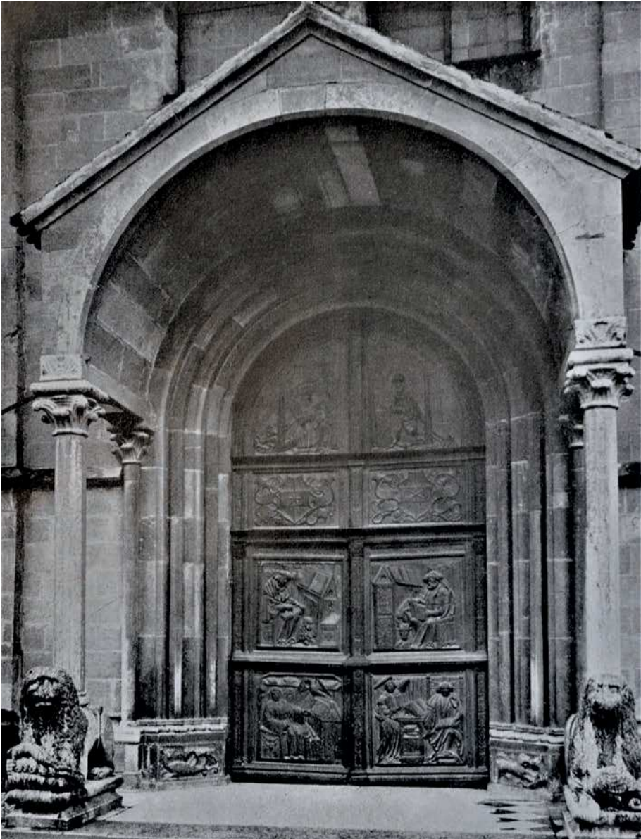
■ 15. Bolzano, duomo, portale maggiore, fotografia storica prima del bombardamento del 1944

Le Monnier ammira infine la porta lignea del duomo del 1521 39 , “artificiellement et fort industrieusement détaillée en bois des quatre Evangelistes eslevez de singulier artifice”, con le immagini dell’ Annunciazione , degli Evan-