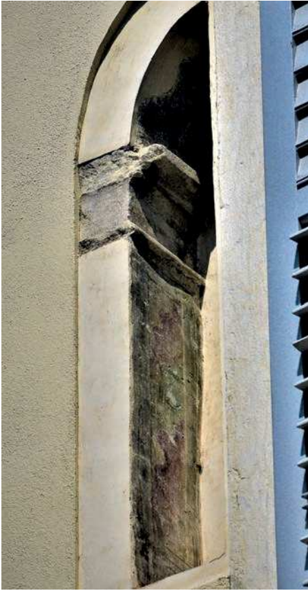
■ 13. Trento, piazza del Duomo, casa de Negri di San Pietro, lato verso settentrione (dettaglio)