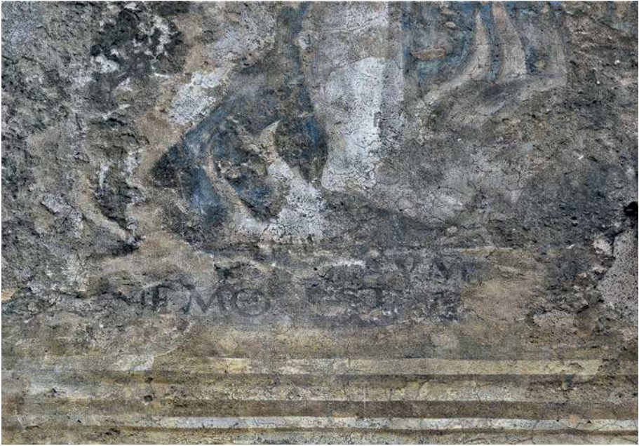
■ 7. Trento, piazza del Duomo, casa Gelpi (dettaglio)