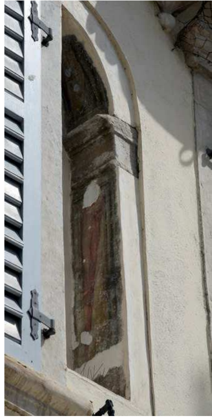
■ 14. Trento, piazza del Duomo, casa de Negri di San Pietro, lato verso settentrione (dettaglio)

mea damna sagax 26 . Vivere quae fatum possum prudentia certam. In quaecumque 27 voles me duce carpe [cerne?] viam 28 .