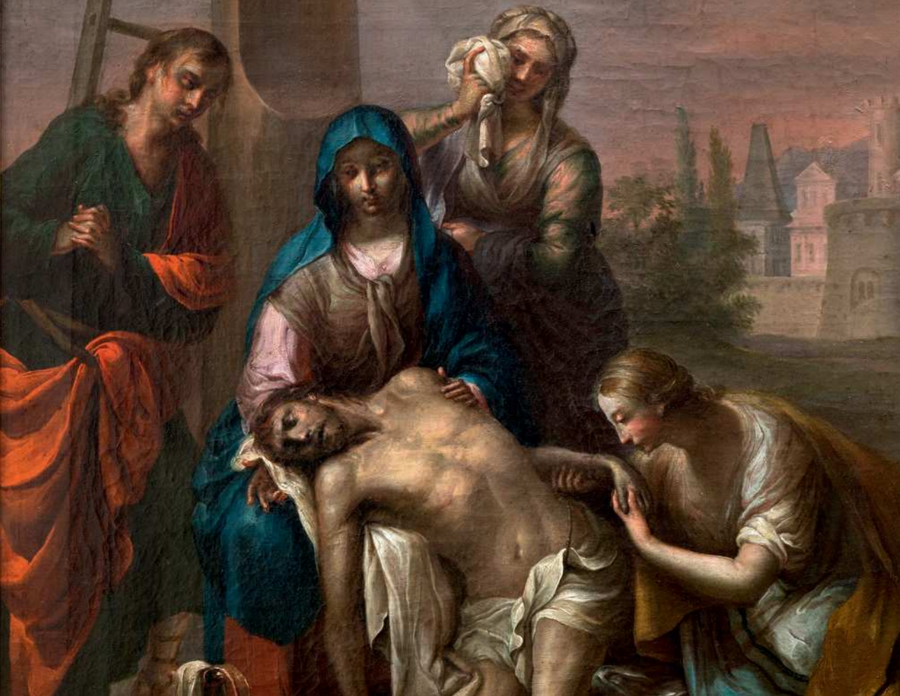
■ 6. Martin Knoller, Compianto sul Cristo morto , particolare, ante 1803, olio su tela. Collezione privata

volti, che sulla pala risultano meno patetiche e sentite, più accademiche e composte. Le cromie luminose e profonde (i rossi e i blu) risaltano in modo anche più accentuato sulle tinte pastello e cangianti – delicatissimi i passaggi sulla veste di Maria di Cleofe – e pare enfaticizzata la resa lucente dell'epidermide o della bella natura morta in primo piano. Nondimeno, la corrispondenza di questo sorvegliato studio pittorico rispetto alla tela licenziata nel 1803 è palmare.