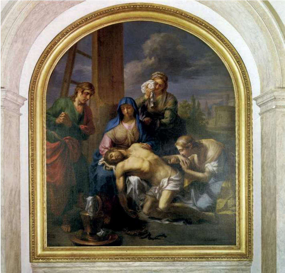
■ 5. Martin Knoller, Compianto sul Cristo morto , 1803, olio su tela. Bolzano, chiesa di Sant'Agostino

affatto di bozzetti sommari, bensì di opere finite, connotate non di rado da una qualità pittorica anche più elevata.