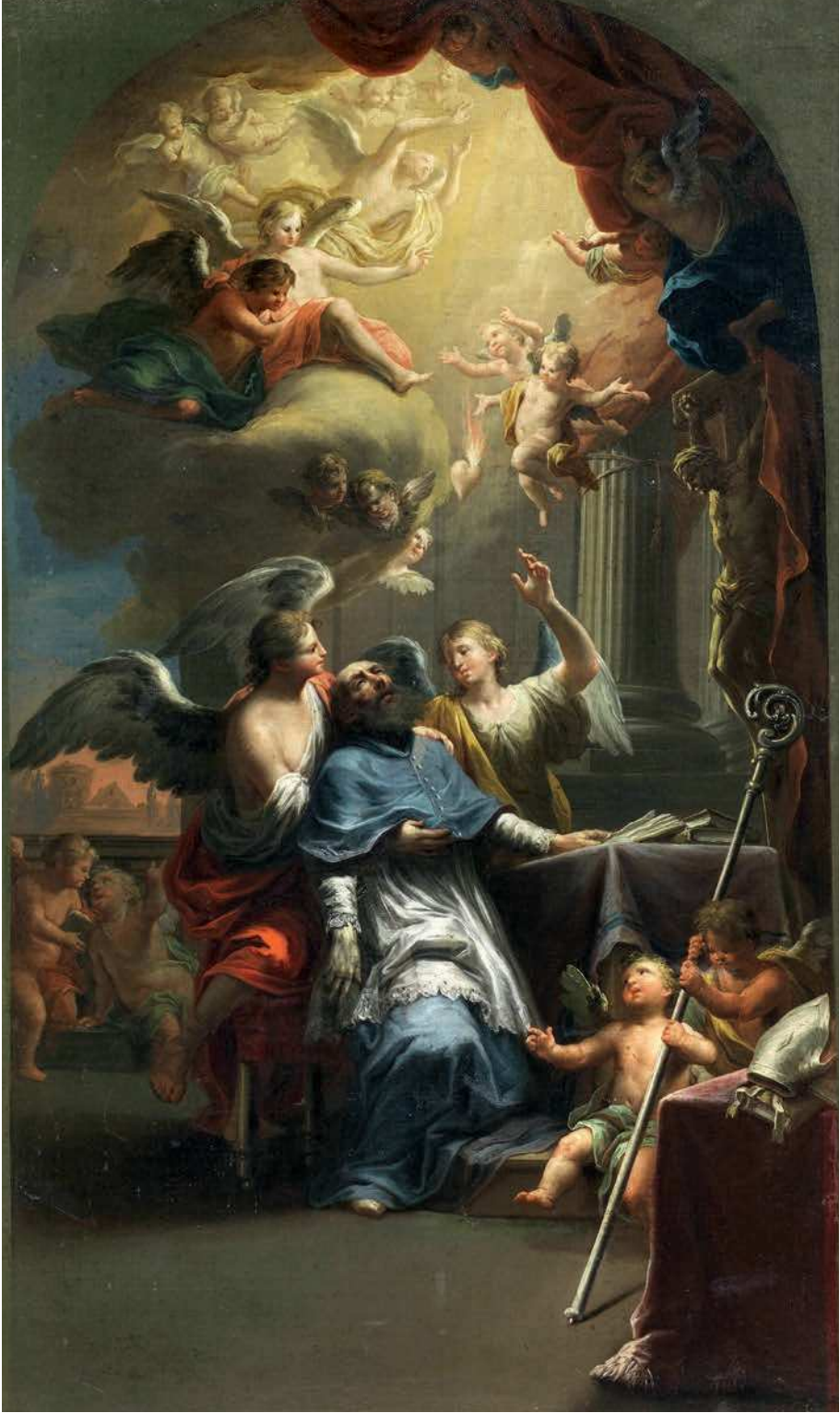
■ 3. Martin Knoller, Visione di Sant'Agostino , 1773 c., olio su tela. Mercato antiquario