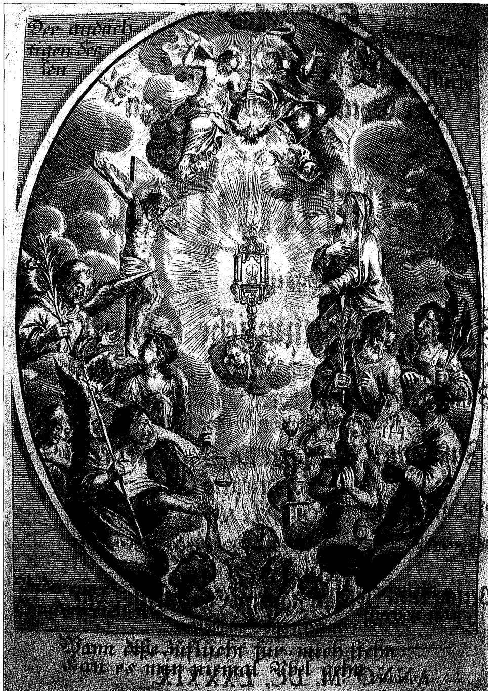
■ 1. Frontespizio dell'opera Heylwürkende Andacht der Gottliebenden Seelen zu den Siben Zufluchten , München 1689