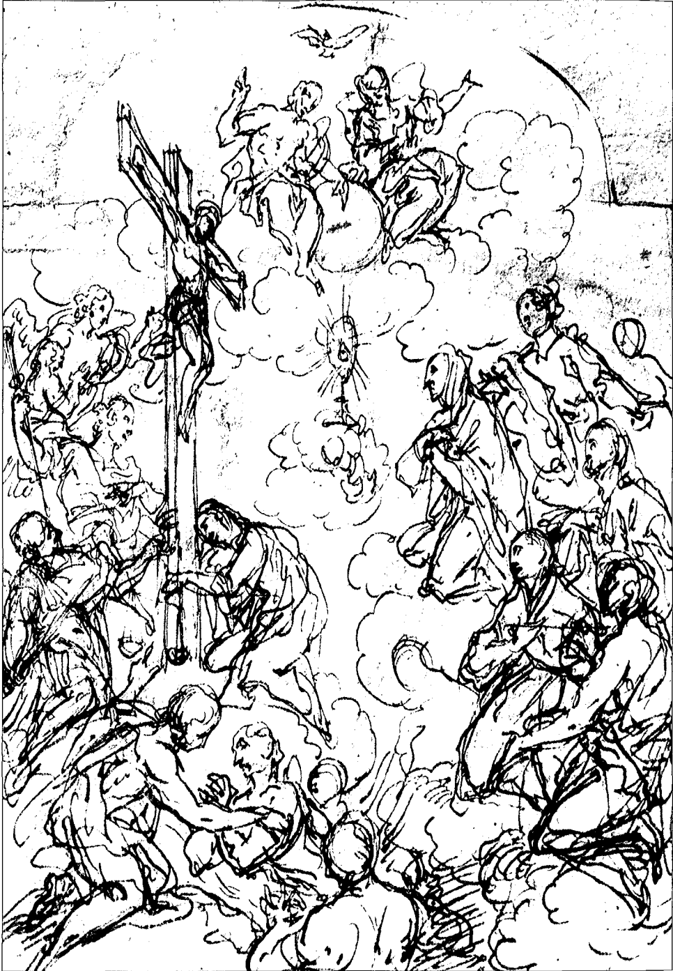
■ 2. A. Triva, I Sette Rifugi santi , disegno (Monaco, Graphische Sammlung, Inv. Nr. 30057; H. M. II.82)