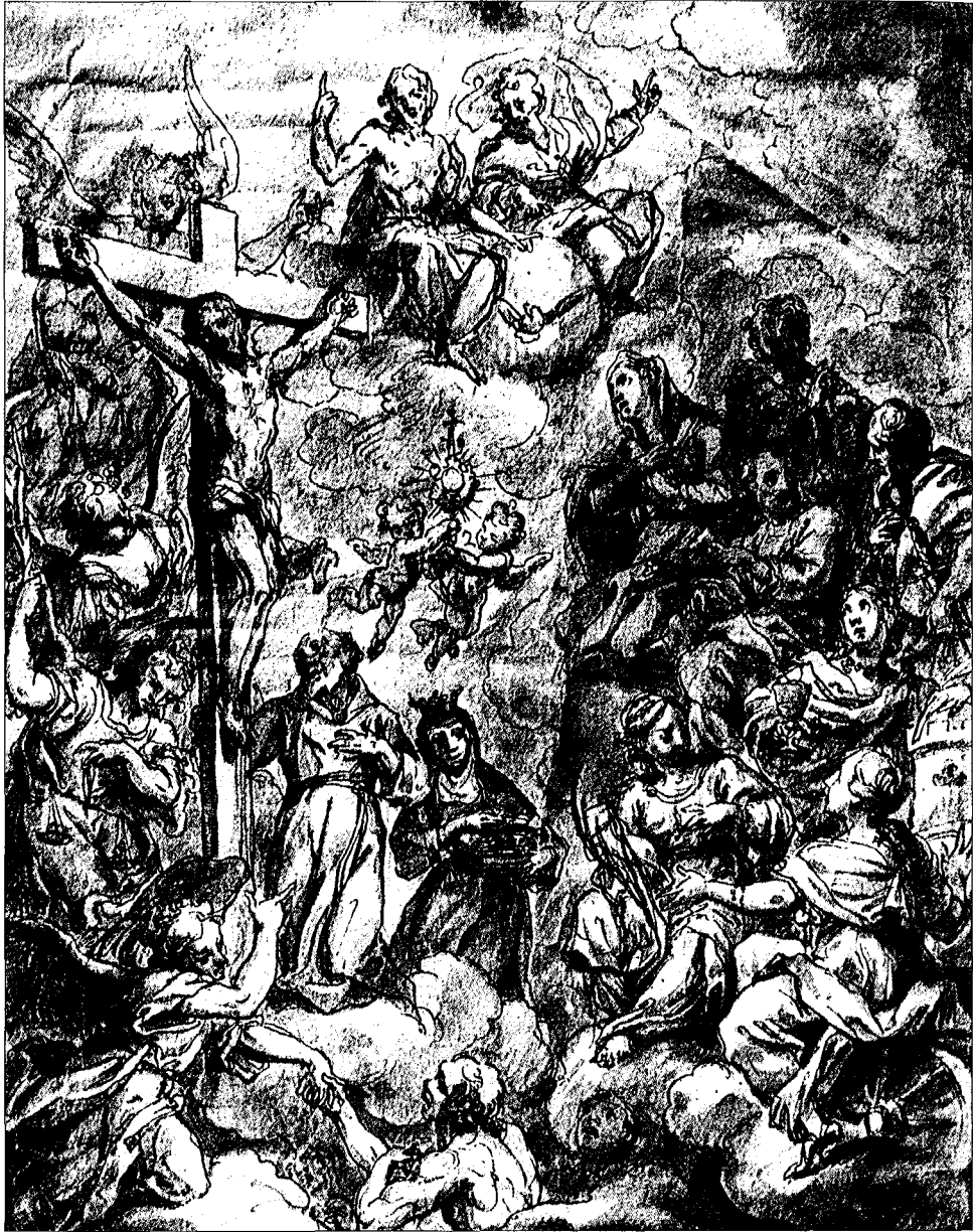
■ 4. A. Triva, I Sette Rifugi santi , disegno (Monaco, Graphische Sammlung, Inv. Nr. 30056; H. M. II. 82)