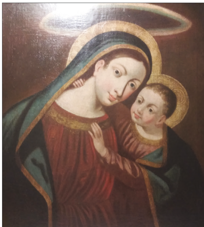
■ 19. Pittore degli inizi dell'Ottocento, copia della Madonna del Buon Consiglio "dei Zusefi – Visintainer". Collezione privata

so un'iconografia come quella della Madonna del Buon Consiglio, così profondamente radicata in personaggi diversissimi fra loro, dovettero giocare un ruolo fondamentale anche sentimenti meno ovvi della semplice religiosità e declinati da ciascuno in chiave autobiografica: da un commosso attaccamento alle proprie origini, all'affetto e alla venerazione per i propri antenati.