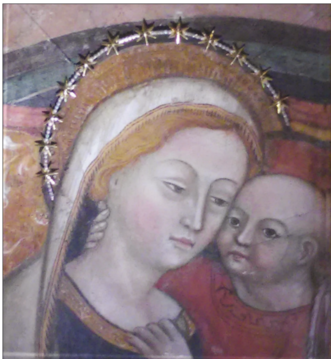
■ 1. Madonna del Buon Consiglio , prima metà del XV secolo. Genazzano, Santuario della Madonna del Buon Consiglio

patria che emigrati, tanto che ancora oggi la Madonna del Buon Consiglio è nota anche col titolo di Madonna degli Albanesi.