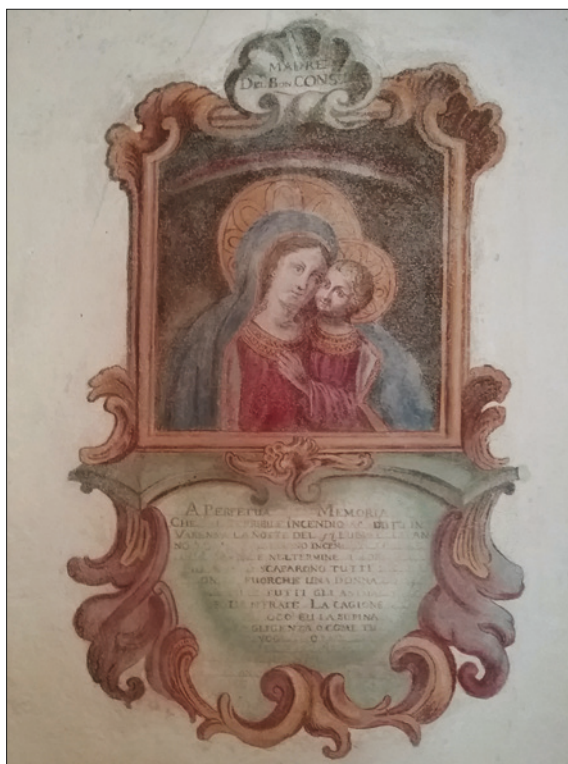
■ 13. Antonio Longo, La Madonna del Buon Consiglio , 1765. Varena, Museo casa natale di Antonio Longo