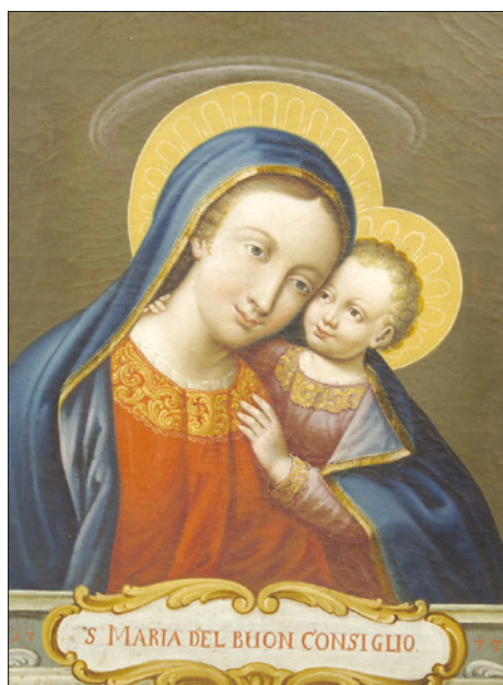
■ 15. Copia della Madonna del Buon Consiglio , 1777. Taio (Val di Non), casa canonica