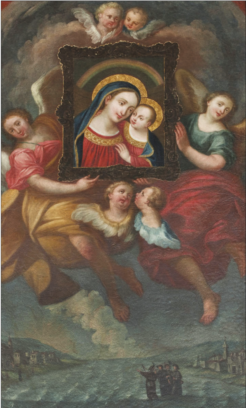
■ 18. Traslazione della Madonna del Buon Consiglio per mano angelica , seconda metà del Settecento. Terlago, chiesa di Sant'Andrea