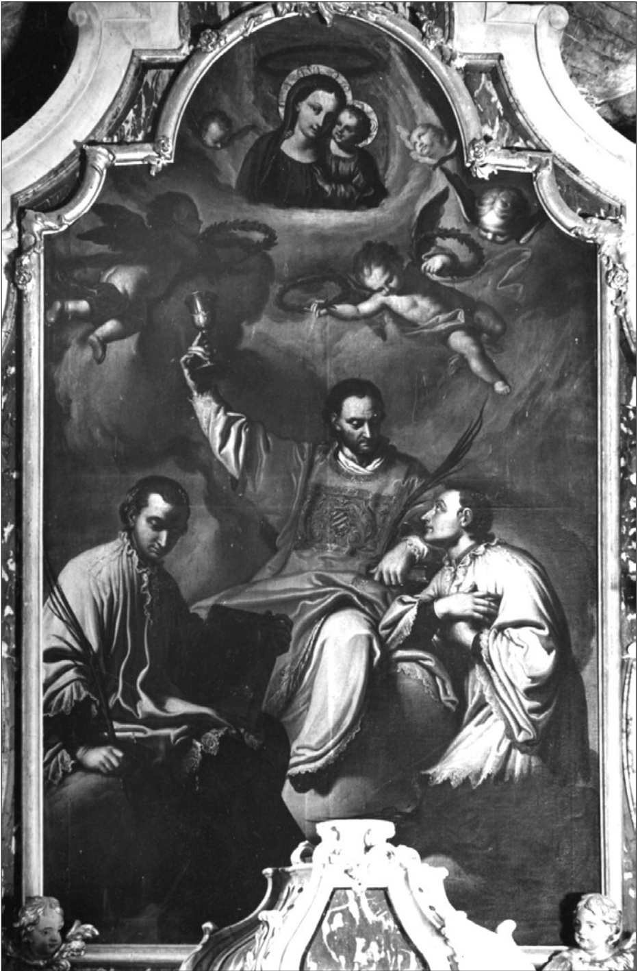
■ 8. Giovanni Battista Lampi, pala d'altare con I Santi Martiri Anauniesi in gloria con la Madonna del Buon Consiglio , 1775. Sanzeno, Basilica dei Santi Martiri Anauniesi