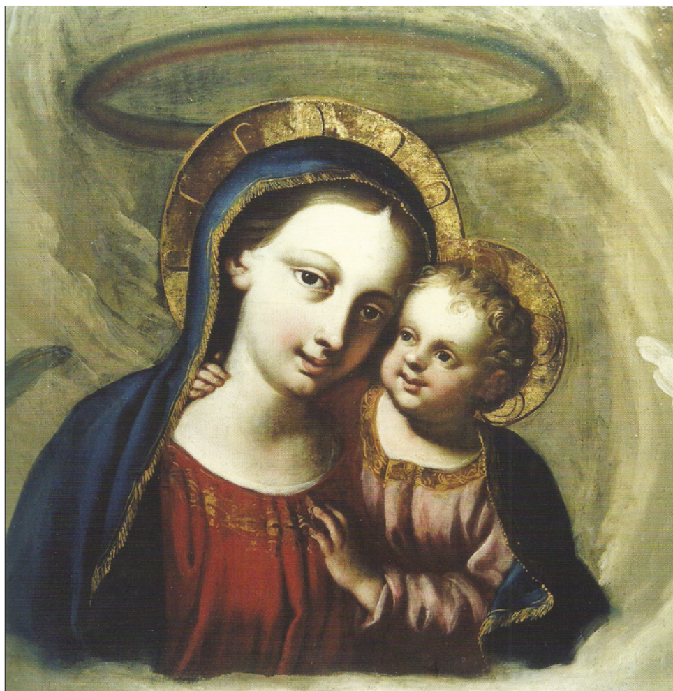
■ 9. Copia della Madonna del Buon Consiglio inglobata nella pala del Lampi a Sanzeno

cope 29 . La morte improvvisa non gli permise di confessarsi né di ricevere i dovuti sacramenti, se non un'affrettata estrema unzione. Bisogna tenere presente la distanza che separa la mentalità odierna da quella dell'epoca, condizionata da una fortissima spiritualità. I concetti di vita ultraterrena, di Purgatorio e di Limbo, erano allora considerati verità effettive. Non c'erano dubbi sulla sorte che toccava all'anima di chi moriva in quel modo.