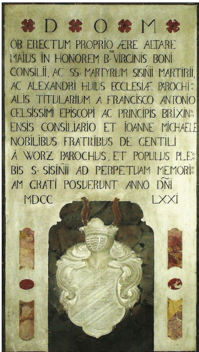
■ 10. Lapide commemorativa del completamento del nuovo altare maggiore, 1771. Sanzeno, Basilica dei Santi Martiri Anauniesi