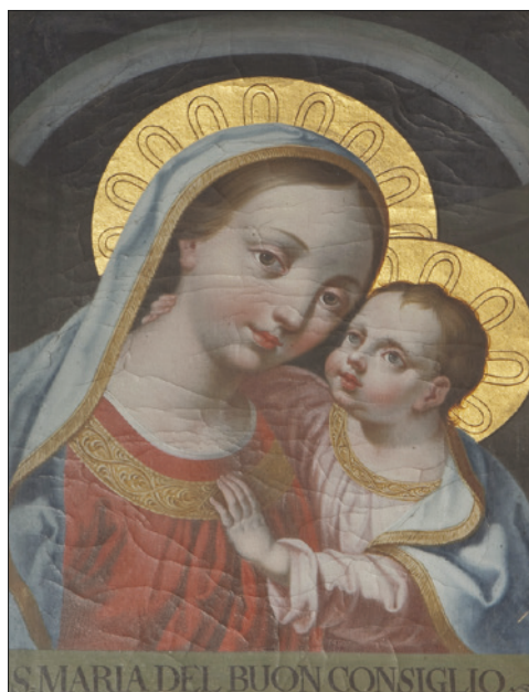
■ 16. Copia della Madonna del Buon Consiglio , seconda metà del Settecento. Tamion, Vigo di Fassa, chiesa della SS. Trinità

pinto presente un tempo nella curaziale di Nanno (ma oggi scomparso 39 ) e un ex voto nella canonica di Sanzeno (fig.14), la cui composizione sembra curiosamente preludere alla pala del Lampi. Sappiamo poi di una copia su rame, eseguita a Cles nel 1773 dal pittore Pietro Antonio Lorenzoni (1721-1782, noto per i suoi ritratti della famiglia Mozart), oggi purtroppo dispersa 40 . Del 1775, oltre alla magnifica pala d'altare del Lampi, era la già ricordata copia tratta dall'originale di Genazzano, un tempo a Casa de Gentili e oggi in mano privata 41 . A Taio troviamo l'immagine non solo su di una pala del 1777 (fig. 15), ma anche su di un calice d'argento smaltato del secondo Settecento. A San Michele all'Adige abbiamo una copia nella casa canonica e altre immagini dipinte sulle abitazioni (e lo stesso avviene anche a Casez, Lavis e Mezzocorona). Sempre alla seconda metà del Settecento, ma non sappiamo precisamente in quale anno, risalgono una perduta tela del veronese Giandomenico Cignaroli (1722-1793) raffigurante la Madonna del Buon Consiglio con le sante Agata, Apollonia e Lucia che si trovava nel convento agostiniano di San Marco a Trento 42 , nonché le pale d'altare ancora esistenti