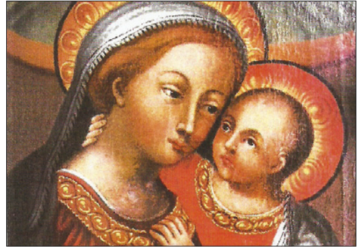
■ 5. Copia della Madonna del Buon Consiglio , 1760. Monaco di Baviera, convento Maria Eich (dalla chiesa dei santi Giovanni Battista e Giovanni Evangelista)