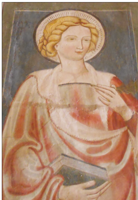
■ 3. Santa martire (Caterina d'Alessandria ?) , particolare, prima metà del XV secolo. Genazzano, chiesa di Santa Croce

membri della famiglia Colonna, nel corso del Cinque e del Seicento la devozione per la Madonna del Buon Consiglio sembra sostanzialmente ridursi a un fatto locale. Giunge quindi alquanto inaspettata la vigorosa riemersione del culto che ebbe luogo nel corso del Settecento, quando assistiamo a un'imponente diffusione di copie dell'immagine sacra che si dirama da Genazzano sia verso il Meridione (Calabria, Puglia e Sicilia), sia a Nord, giungendo presto olttralpe, verso l'Europa centrale (Germania, Austria, Boemia).