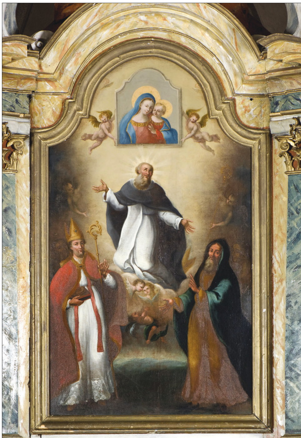
■ 17. Pittore della seconda metà del Settecento, La Madonna del Buon Consiglio venerata dai santi Bernardo, Vigilio e Antonio abate . Bresimo, chiesa di San Bernardo