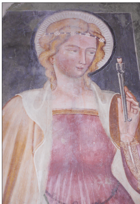
■ 2. Sant'Apollonia , particolare, prima metà del XV secolo. Genazzano, chiesa di Santa Croce