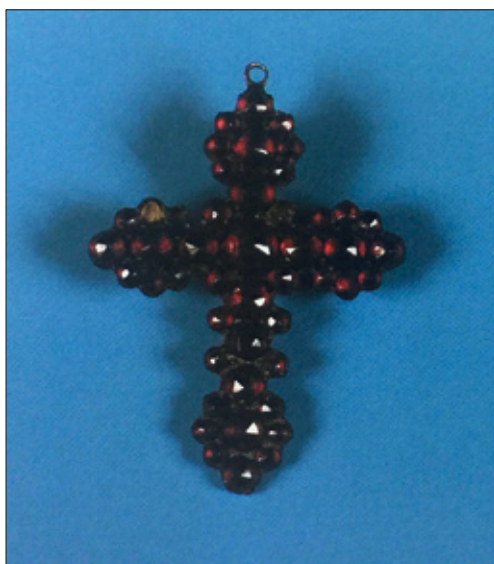
■ 6. Orafo trentino, Crocetta di granati per collana , XVIII secolo. Trento, Antiquariato Bruno Gasperetti