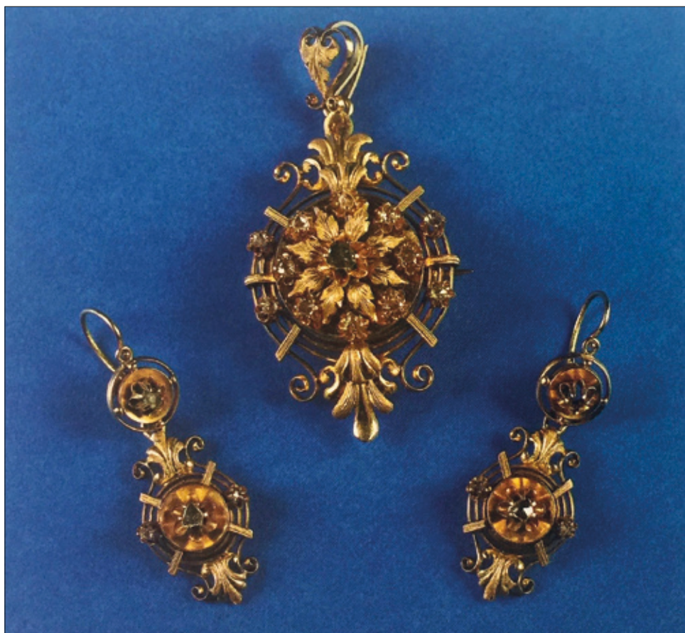
■ 5. Orafo trentino, Spilla e orecchini , XVIII secolo. Rovereto, Antiquariato Santino Li Destri