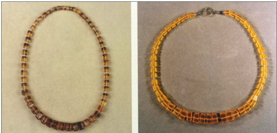
■ 9. Collane di ambra , prima metà XVIII secolo. Valle di Sole, collezione privata