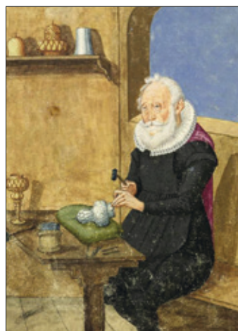
■ 3. L'orefice Friderich Direr , miniatura, 1632. Norimberga, Stadtbibliothek, Amb. 317b.2°, c. 110v

La consultazione di atti civici, archivi di famiglia e notarili presso gli istituti di conservazione del territorio provinciale ha consentito di fare chiarezza sulla figura dell’orefice e delineare i caratteri di una professione che in molteplici casi veniva trasmessa di padre in figlio, o al genero in assenza di eredi diretti maschi, e così ai nipoti, non solo portando avanti una conoscenza artigiana e una maniera stilistica peculiare di una determinata bottega e di una specifica zona d’influenza, ma favorendo anche il passaggio in eredità degli strumenti di bottega e dei beni presenti nelle case. Gli atti testamentari e gli inventari dei beni in particolare si dimostrano un utile strumento per lo studio di questi artisti, del loro stile di vita, della ricchezza accumulata, degli arnesi da orefice utilizzati e dei rispettivi appellativi, e per chiunque intenda svolgere uno studio comparativo sulle mode e i costumi nei secoli, sulle consuetudini testamentarie e sulla presenza di determinati oggetti all’interno delle case (figg. 2, 3).