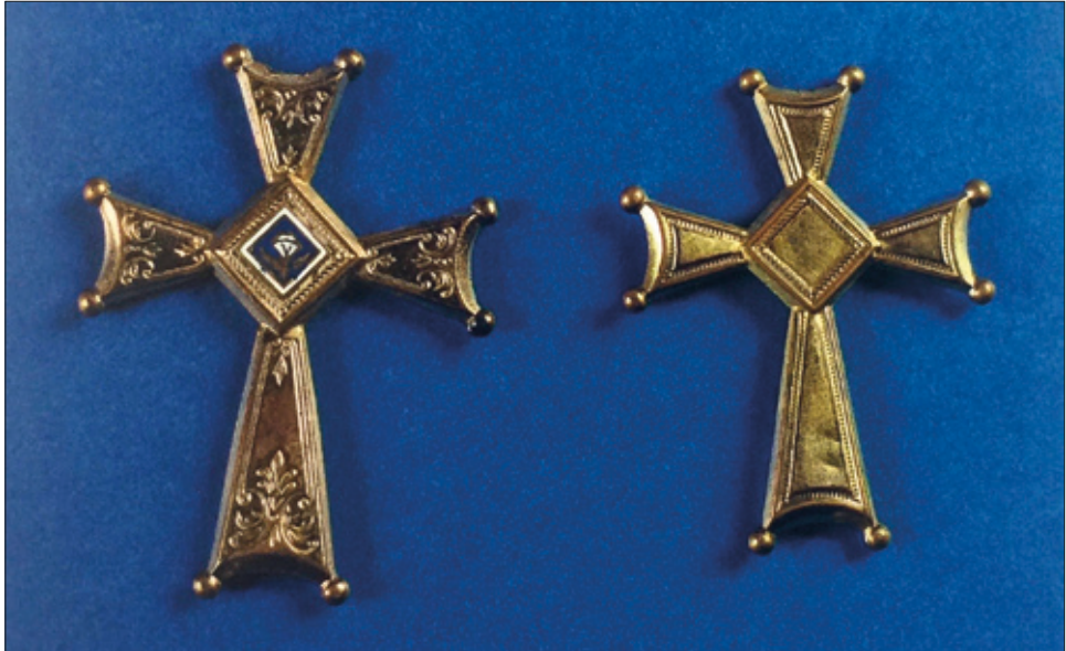
■ 8. Orafo trentino, Crocette per collane , XVIII-XIX secolo. Rovereto, Antiquariato Santino Li Destri