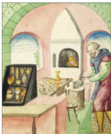
■ 2. L'orefice Wolff Prussel , miniatura, 1572. Norimberga, Stadtbibliothek, Amb. 317b.2°, c. 30r

va di peculiarità e punti di vista singolari – su una classe di artigiani che ha cambiato volto e funzioni nel corso del tempo.