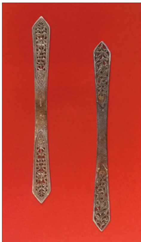
■ 4. Spadine per capelli in argento , XIX secolo. Valle di Sole, collezione privata