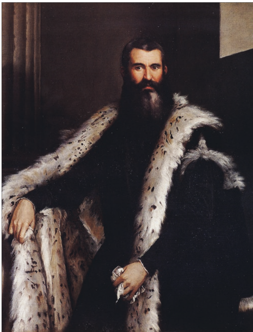
■ 3. Paolo Veronese, Ritratto maschile , terzo quarto del XVI secolo, olio su tela. Firenze, Palazzo Pitti, Galleria Palatina e Appartamenti Reali