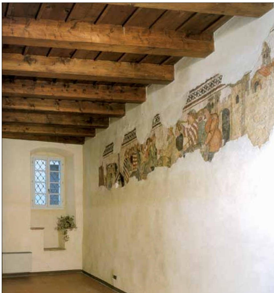
■ Rovereto, palazzo Noriller, veduta d'insieme della sala affrescata

Mentre la redazione francese si rivolgeva alla grande nobiltà e si appoggiava ad un corredo di luminose immagini per agevolare il racconto, quasi tutte le versioni eseguite in Italia furono affidate a codici di qualità mediocre e privi del supporto delle miniature, dato che sottolinea “una diffusione di livello sociale medio” 24 della narrazione poliana.