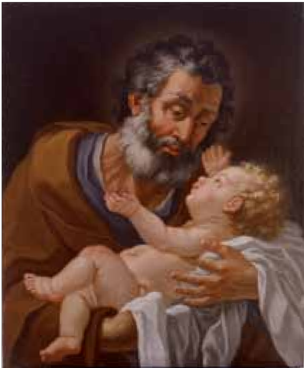
■ 10. Giovanni Maspani (?), San Giuseppe con il Bambino