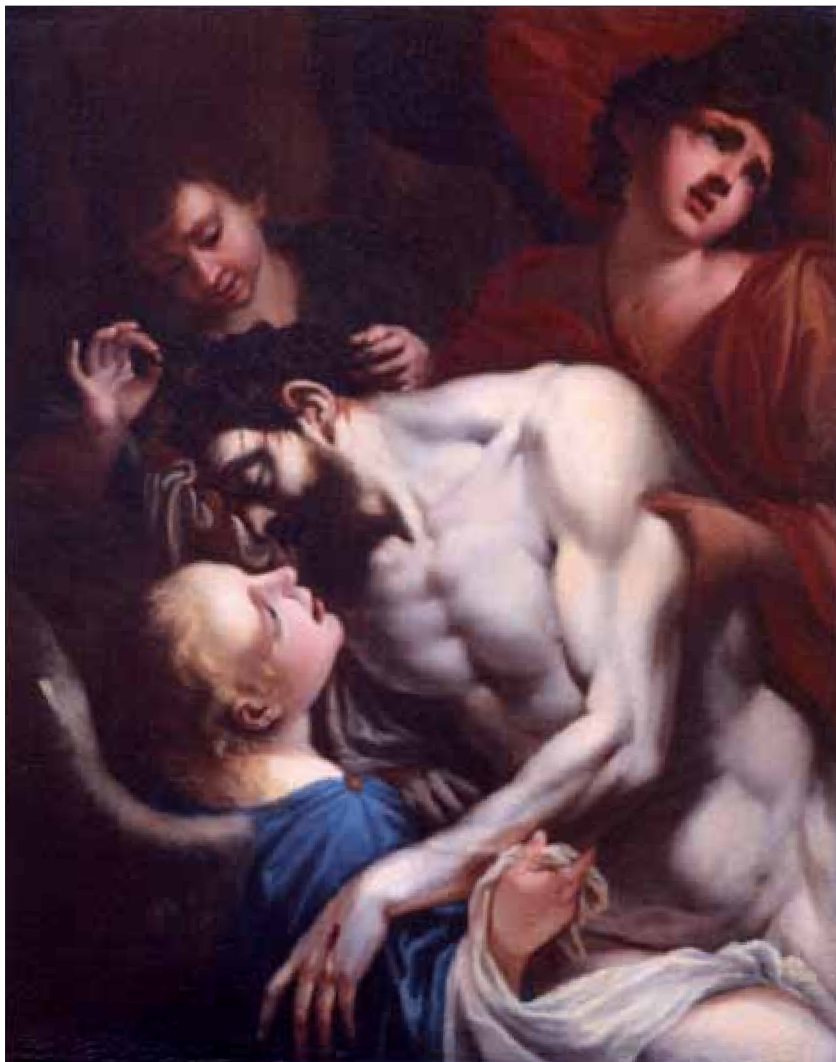
■ 7. Pittore veneto del sec. XVIII, Cristo morto sorretto da angeli