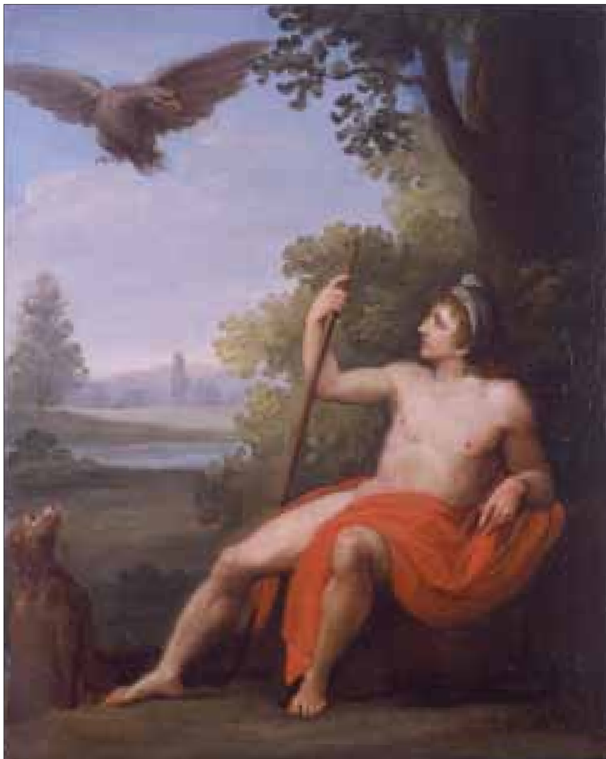
■ 16. Pittore del principio del sec. XIX, Ganimede