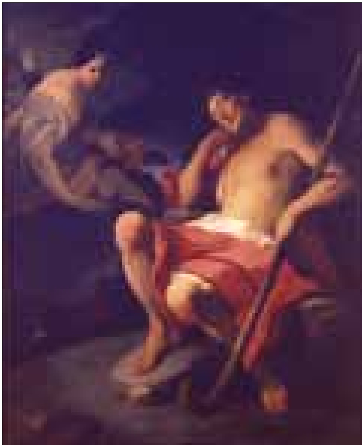
■ 9. Pittore del sec. XVIII, Diana ed Endimione