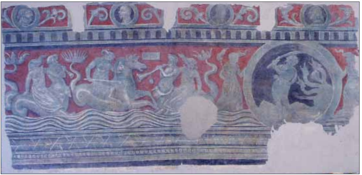
■ 1. Pittore veronese del principio del sec. XVI, Divinità marine; Ercole e l'Idra