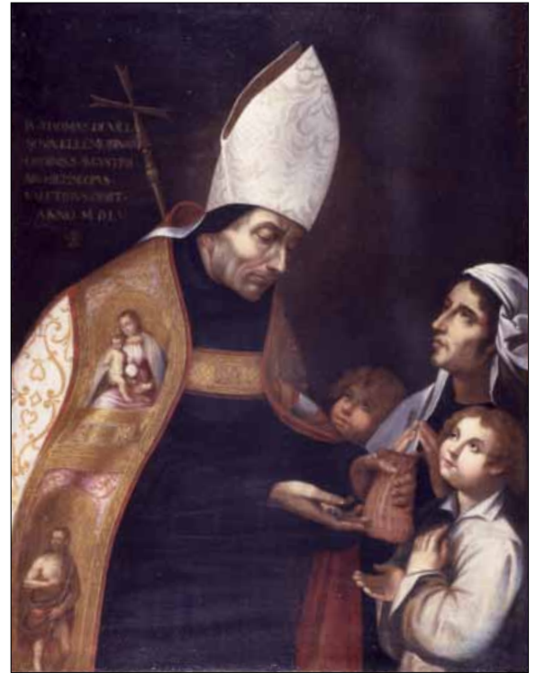
■ 3. Pittore della prima metà del sec. XVII, San Tommaso di Villanova