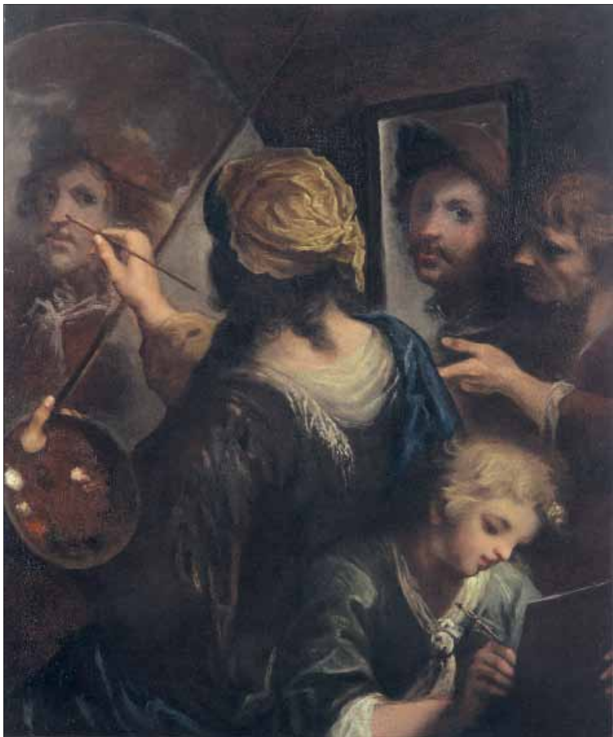
■ 5. Pittore del sec. XVII, Allegoria della Pittura