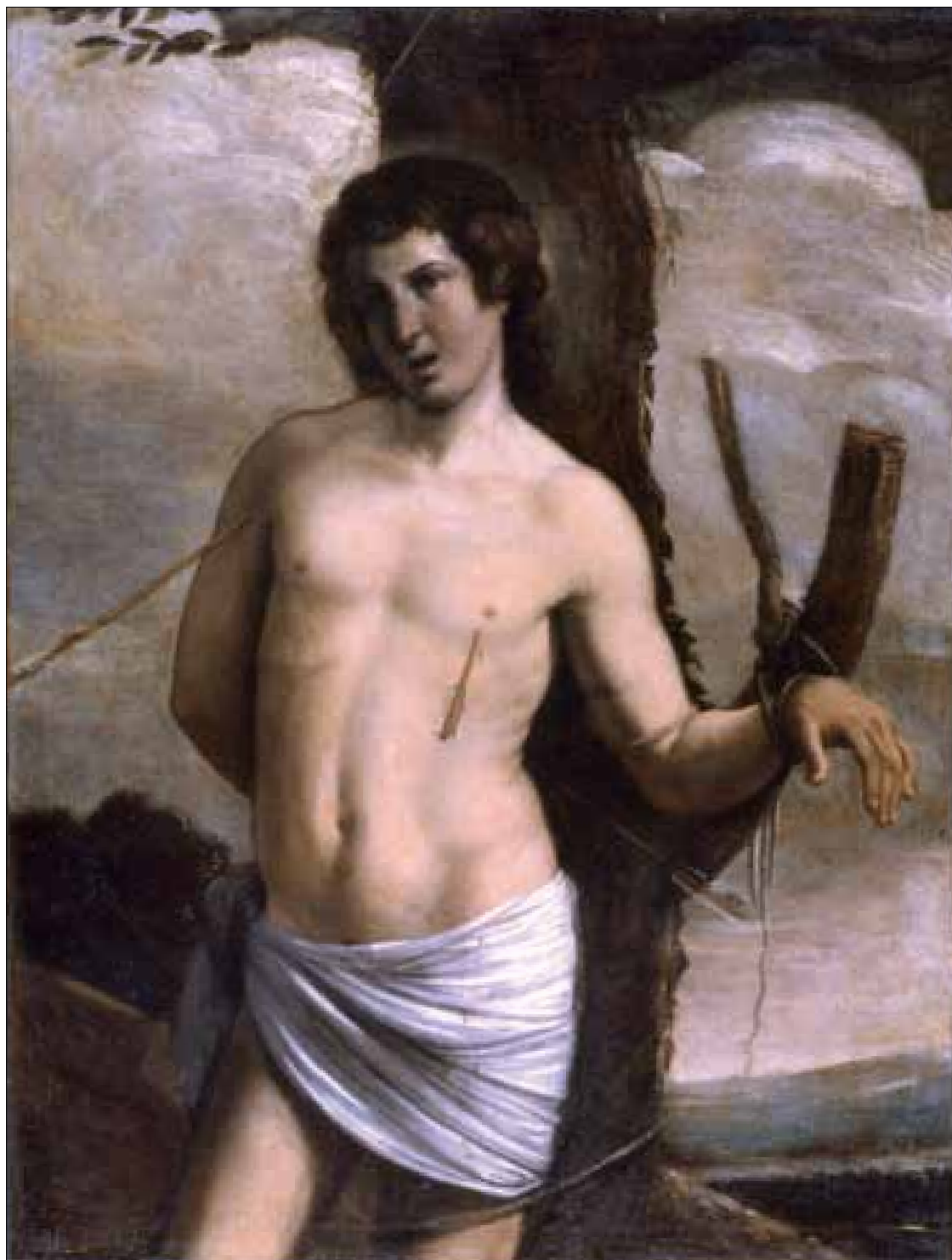
■ 4. Pittore della prima metà del sec. XVII, San Sebastiano