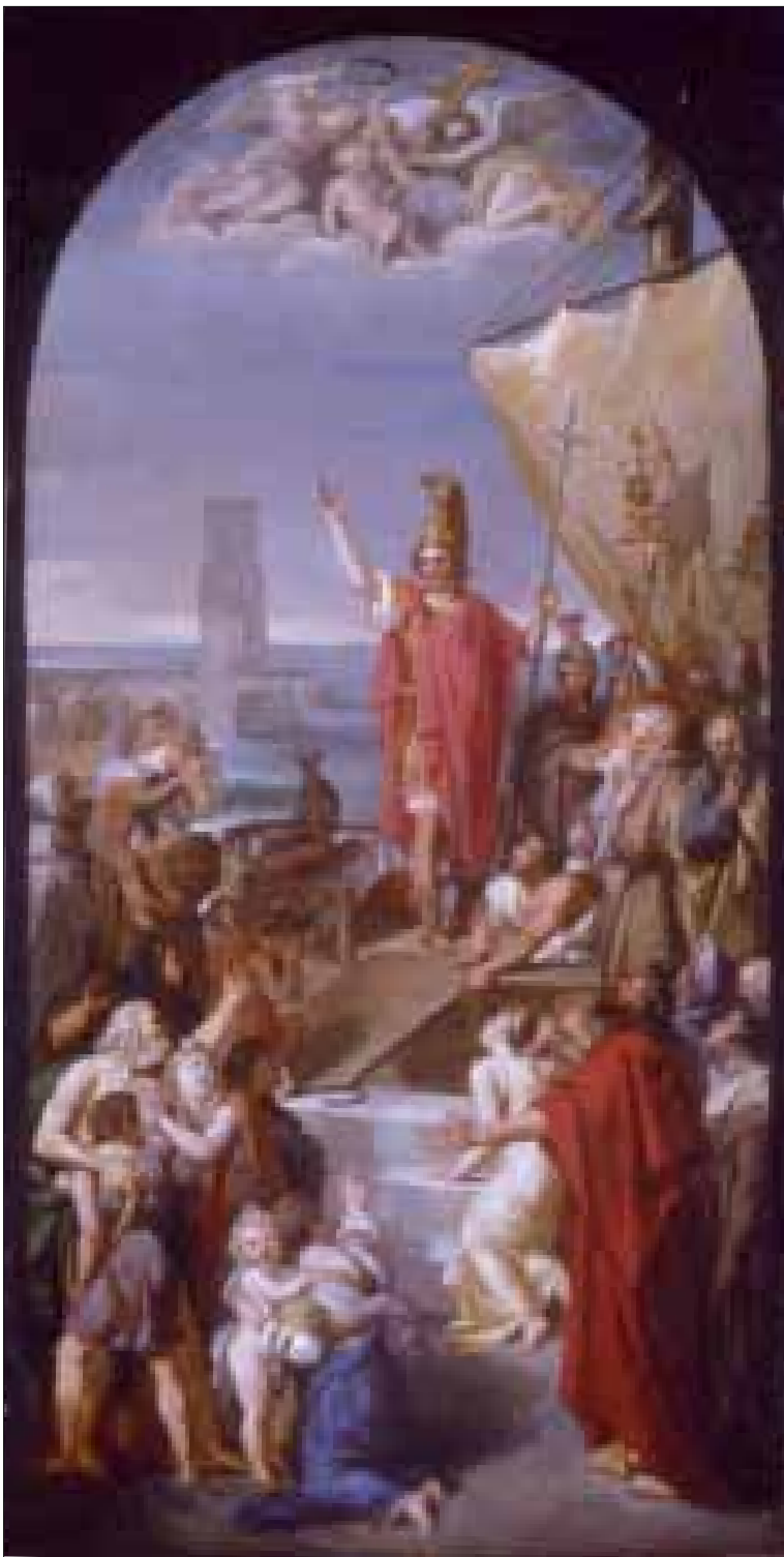
■ 17. Pittore dei primi decenni del sec. XIX, Santo martire