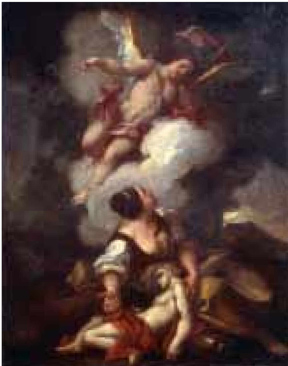
■ 8. Antonio Balestra (?), Apparizione dell'angelo ad Agar nel deserto