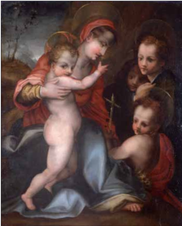
■ 2. Pittore toscano del sec. XVI, Madonna con il Bambino, San Giovannino e angeli