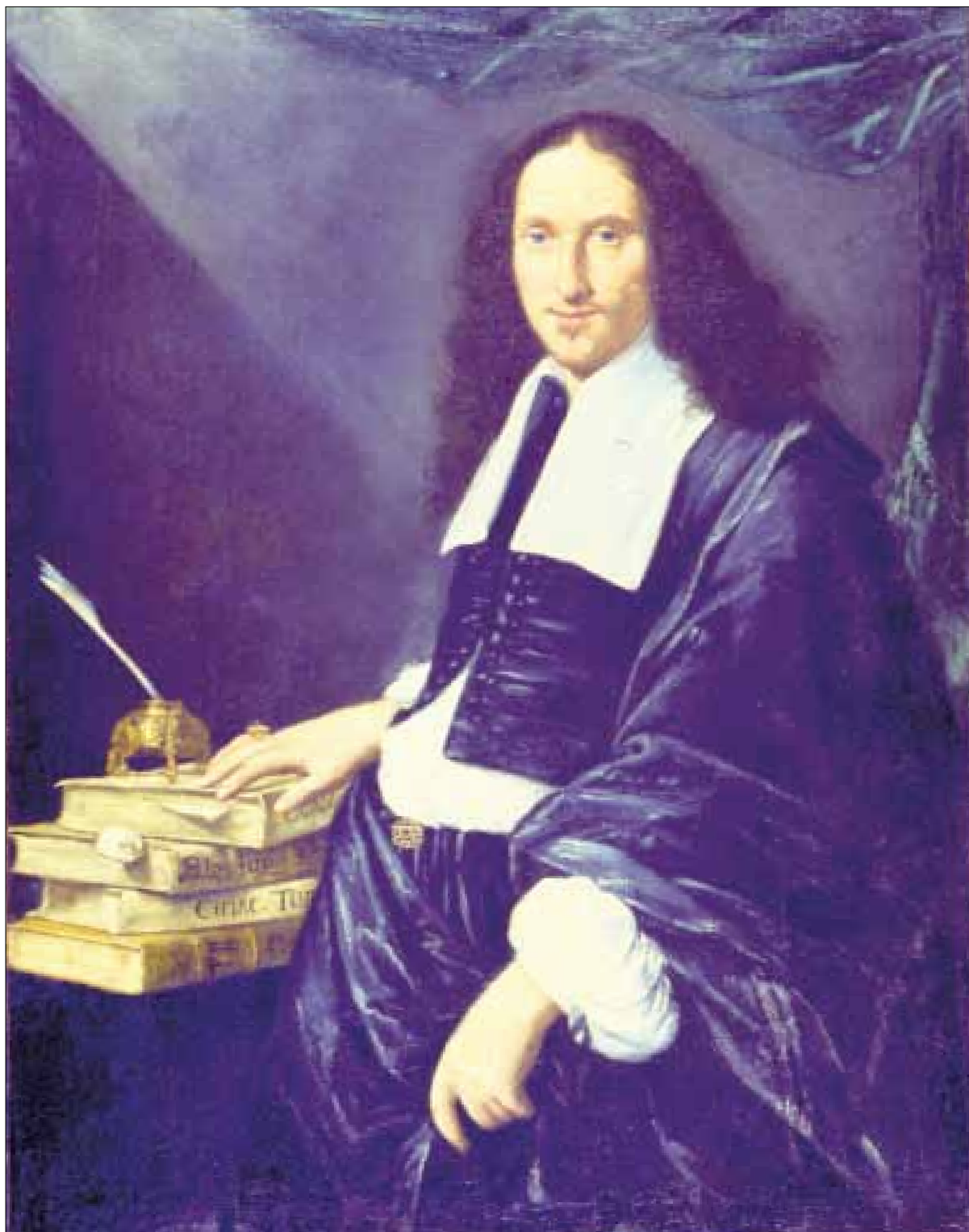
■ 6. Pittore del sec. XVII, Ritratto di giureconsulto