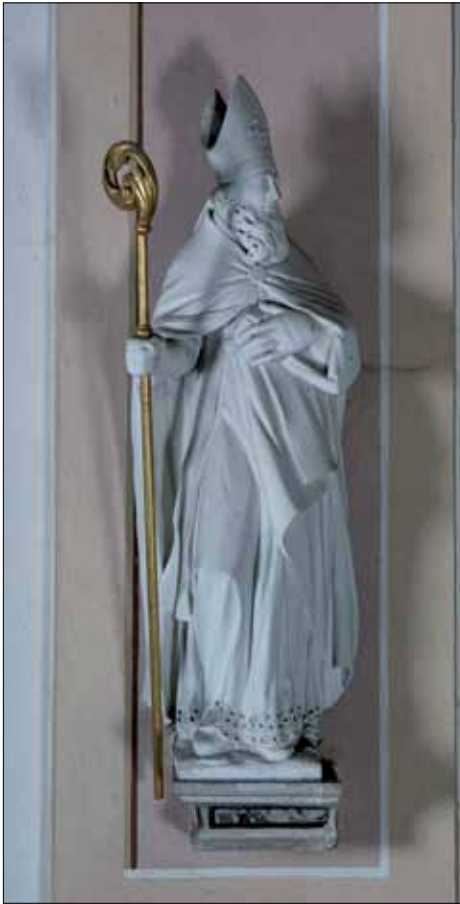
■ 5. Francesco Faber e bottega, San Zeno , Bolbenu, chiesa di San Zenone