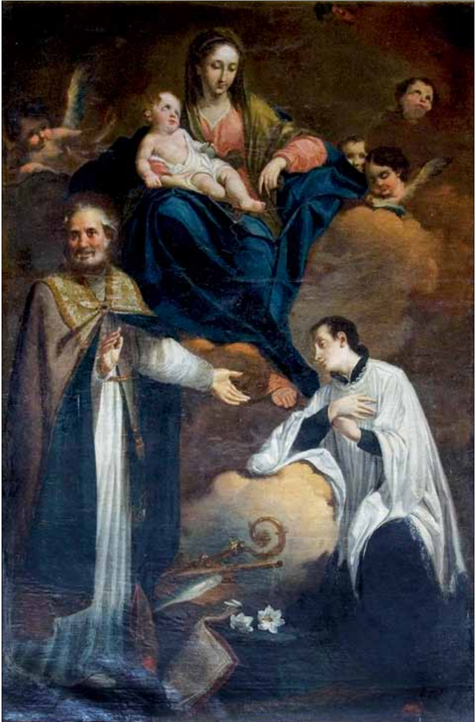
■ 2. Saverio Dalla Rosa, Madonna col Bambino e i Santi Zenone e Luigi Gonzaga , Bolbenu, chiesa di San Zenone