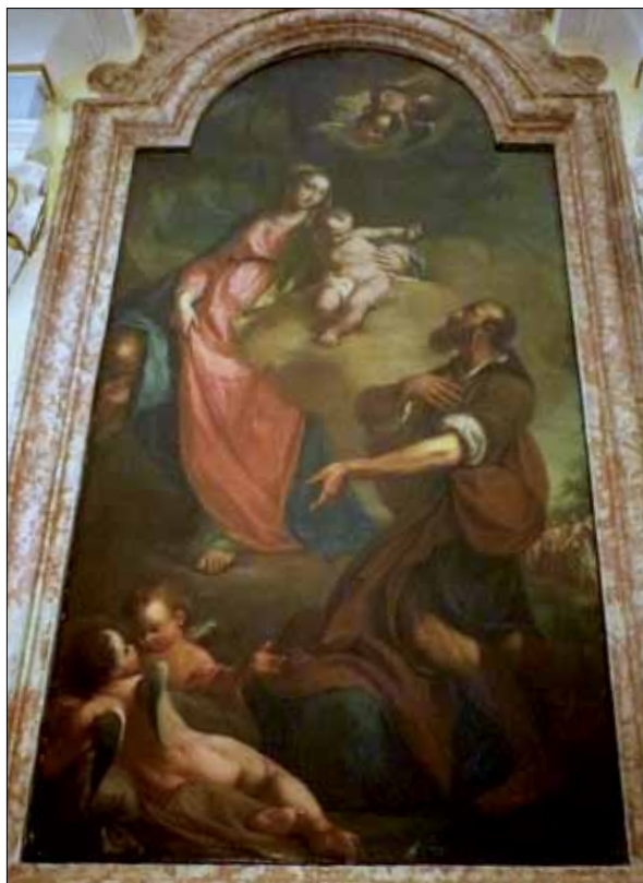
■ 1. Saverio Dalla Rosa, Madonna col Bambino e Sant'Isidoro , Martignano (Trento), chiesa di Sant'Isidoro

di stampo marcatamente pietistico e devozionale, con tuttavia un'apertura ad influenze neoclassiche negli ultimi anni di attività. Le sue prove migliori vengono invece offerte nel campo della ritrattistica, dove aderisce ad una pittura che si potrebbe quasi definire illuministica, nella quale abbandona le sognanti e irreali atmosfere dei suoi precedenti dipinti a tematica religiosa 6 .