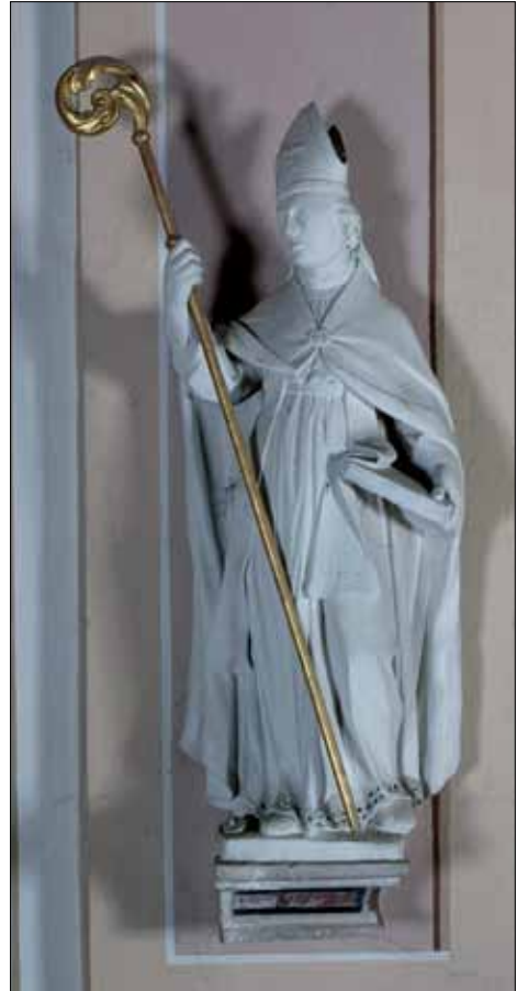
■ 6. Francesco Faber e bottega, San Vigilio , Bolbenu, chiesa di San Zenone

beno sono di piccole dimensioni (Figg. 5-6), leggermente più grande è San Zeno (cm 112) rispetto a San Vigilio (cm 104); la prima ha i generici attributi di un vescovo, ossia mitria e pastorale mentre è assente qualsiasi elemento che lo identifichi specificatamente come il patrono di Verona e il suo riconoscimento viene solamente suffragato dalla destinazione e dal contratto. L'altro presule è invece raffigurato come un giovane imberbe, abbozzante un timido sorriso, che regge nella mano sinistra un libro sul quale pende una stola ricamata da