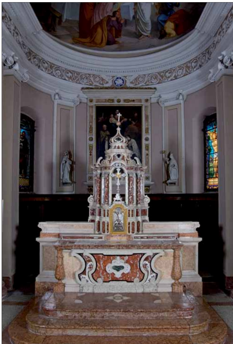
■ 4. Bolzano, chiesa di San Zenone, veduta del presbiterio