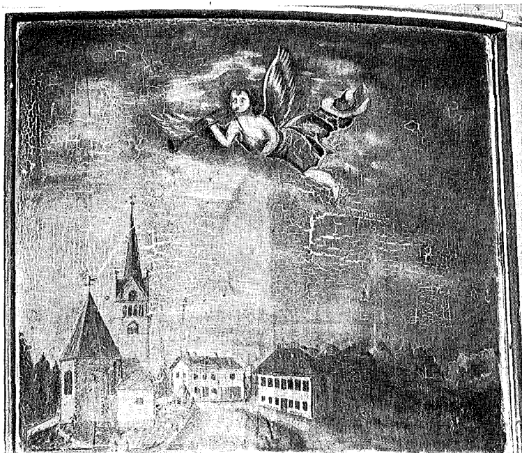
Fig. 3 - S. Giovanni pieve di Fassa: Quadro ad olio su tavola dei primi dell'Ottocento esistente sul frontale dell'orchestra. Si vedono la pieve, l'osteria, la canonica e le Dolomiti. Appena decifrabili le stazioni della Via Crucis (attorno al cimitero e la cappella mortuaria). Probabile pittore A. Cincelli.