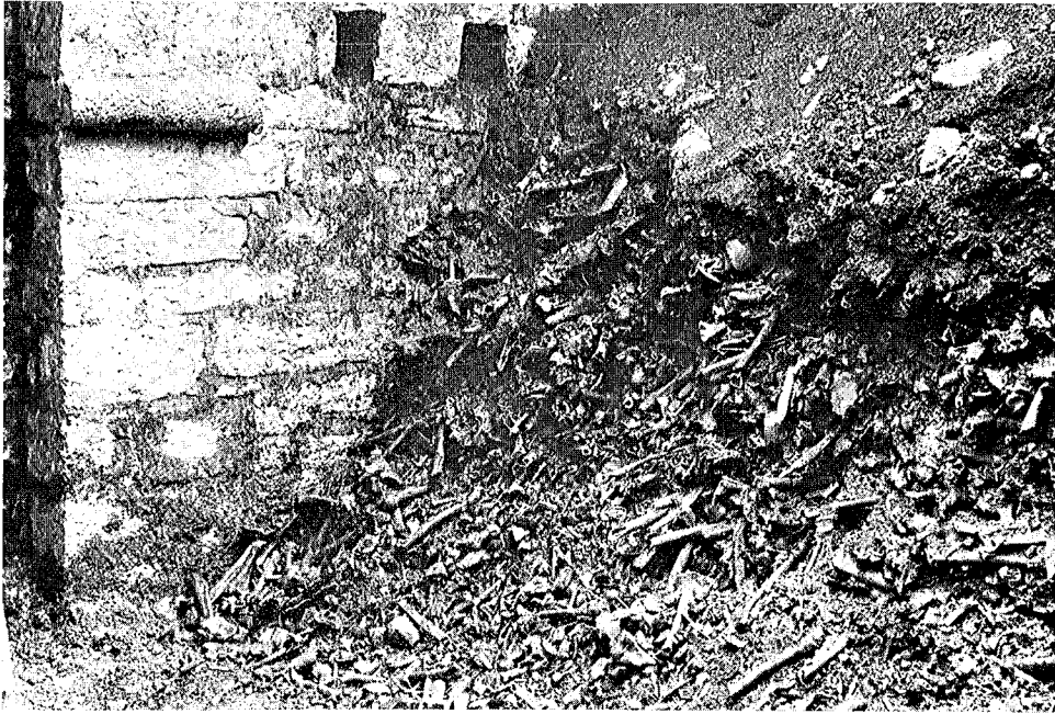
Fig. 1 - Cripta ossario dell'antico cimitero di s. Maria Maggiore a Trento. Nella catasta di ossa umane i teschi sono pochissimi. (Per gentile concessione dell'Assessorato alle Attività Culturali e Sportive della Provincia di Trento).