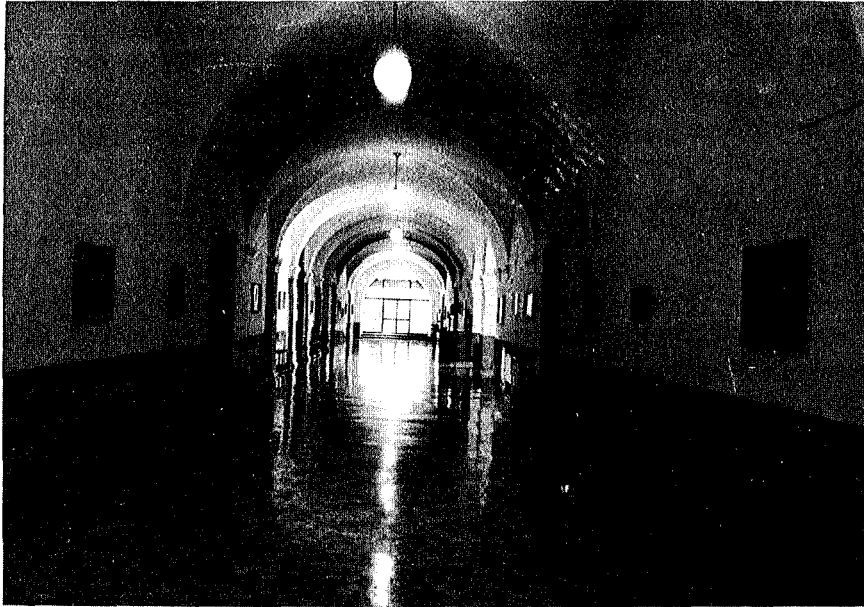
Fig. 8. - Uno dei corridoi sui quali si affacciano le aule e la sala docenti con mobili d'epoca.