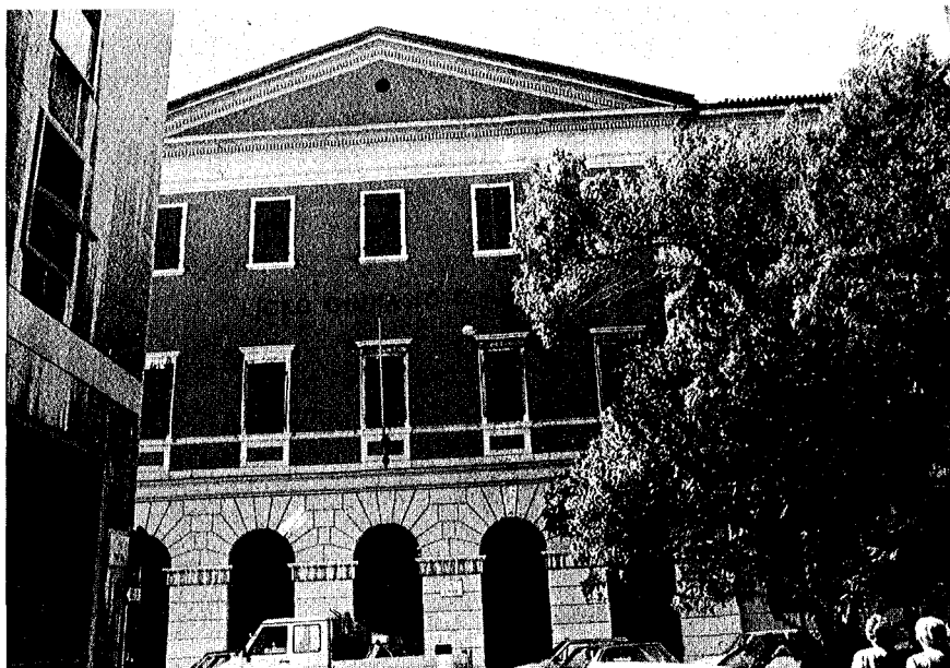
Fig. 7. - La facciata del Ginnasio Liceo e uno scorcio dello scalone come si presentano tutt'ora.