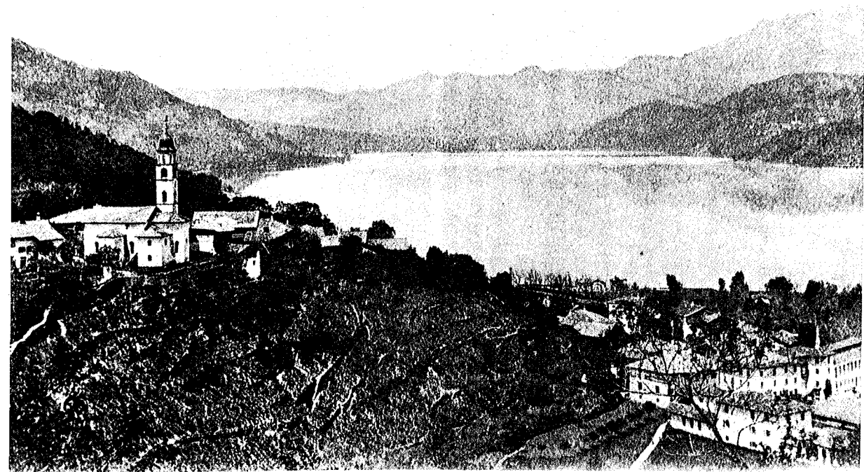
Foto 2: La Pieve di Calceranica a fine Ottocento: al piano, il quartiere da "La Mândola".