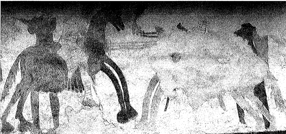
San Paolo di Ceniga, particolare del registro superiore (da Affreschi medievali in Trentino )

sinistra con due miracolate e legge le altre figure come simboli araldici e raffigurazioni di vizi e virtù connesse alla vicenda; i due cavalieri affrontati sovrastanti non sarebbero altro, ancora una volta, che Adelpreto e Aldrighetto.