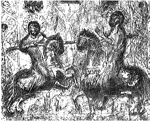
Aldrighetto uccide Adelpreto (Trento, Museo diocesano: lastra della seconda metà del XIII secolo)

adelpretiano nel Duecento 13 ; si aggiunga che il cavaliere di destra non indossa vesti che possano farlo identificare come un ecclesiastico, ma una cotta di maglia, mentre la presenza ravvicinata dei due scudieri fa pensare più ad un duello che ad un'aggressione o ad uno scontro campale. Conseguentemente, le considerazioni di Strocchi sull'interpretazione delle altre figure appaiono del tutto ipotetiche: ci si potrebbe anche chiedere se non vi sia un qualche anacronismo nell'individuazione del leone come simbolo castrobarcense 14 . In conclusione, preso atto della nuova proposta di datazione degli affreschi (che farebbero così parte della decorazione originaria della piccola chiesa, consacrata nel 1186), non sembra di poter considerare valida la lettura iconografica proposta.