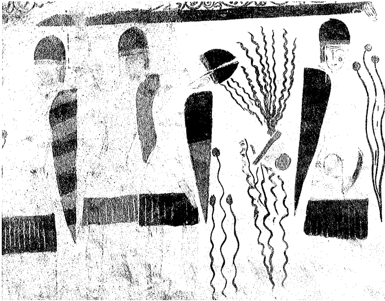
San Paolo di Ceniga, particolare del registro inferiore (da Affreschi medievali in Trentino )