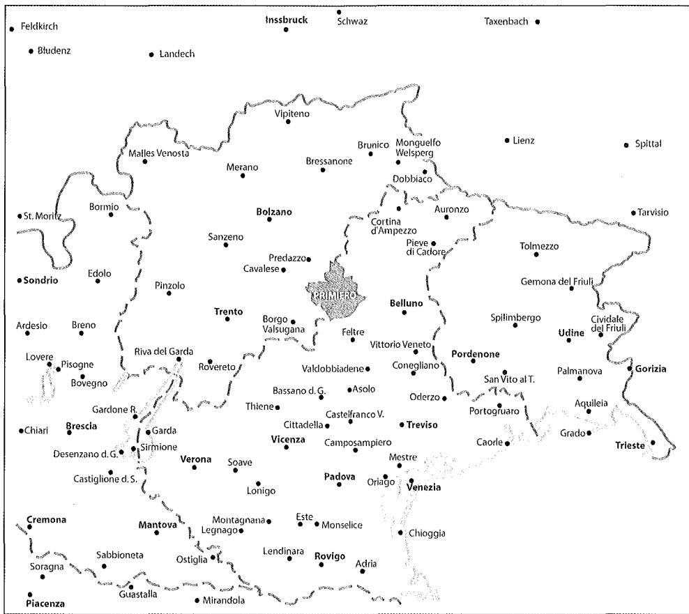
Tavola. 1 - INQUADRAMENTO GEOGRAFICO DI PRIMIERO