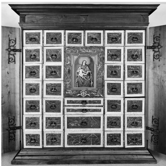
Fig. 1. L'armadio che conteneva l'archivio parrocchiale di Villa Lagarina, opera del mobiliere Giordano Issach (1692). Il cassetto della confraternita è il secondo dall'alto della quinta colonna. Villa Lagarina, Sezione staccata del Museo Diocesano Tridentino (per gentile concessione del Museo)

Paolo Somenzio; nel suo periodo trentino riscosse le rendite di diverse parrocchie della diocesi, ma non vi risiedette. Nel 1517 rinunciò alla pieve di Villa in favore di Francesco Antonio d'Arco 27 ; quest'ultimo era pievano durante la visita pastorale del 1537 28 , quando si criticò il fatto che egli non vi risiedeva, nonostante l'estensione della pieve e l'ammontare della rendita.