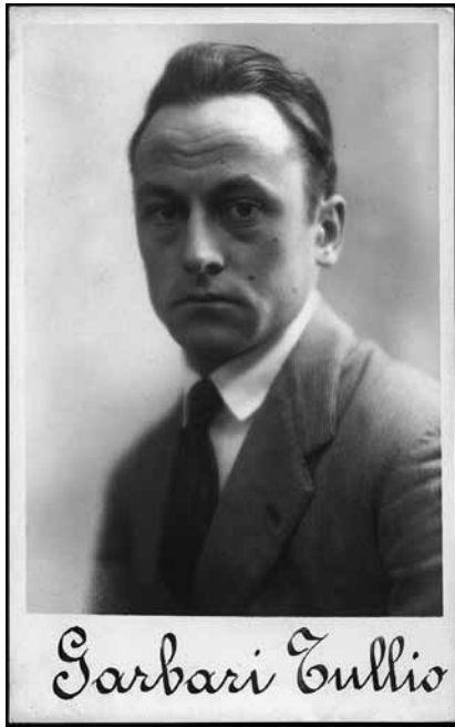
Fig. 4 - Ritratto di Tullio Garbari, anni Venti.