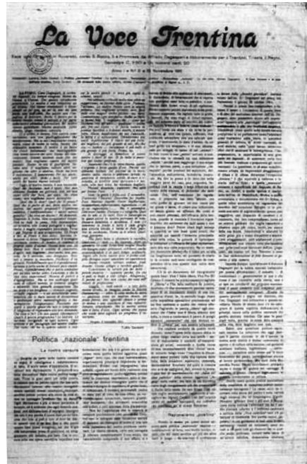
Fig. 5 - "La Voce Trentina", 1 (1911), n. 2, 15 novembre 1911.

giorno di questi a Firenze (febbraio-marzo 1911), interviene con un lungo articolo su Trento e Trieste 88 .